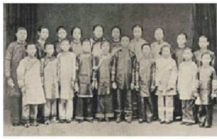
图1 1904年广东女学堂学生摄影

体样式未明确,各学堂学生装束存在差异,但总体上以传统服饰为主,多为长衫、袄裙等(见图1、图2),色彩素雅,风格统一。