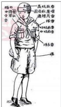
图 11 女童子军制服