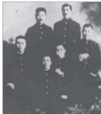
图7 鲁迅等着日式学生制服

1929年规程的核心变化体现在两方面:①制服的种类更为丰富,不同年级学生穿着不同种类服饰,这使得制服的标识性更加明确;另外,从服饰形制上看,对外借鉴程度进一步加深:制服形制按西化程度分为两类,一是全由国外传入的款式,如男生大衣、男学生制服等;②中西结合款式,如女学生的“文明新装”和“旗袍式”制服。男生制服由清末留日学生率先穿着,具体如图7和图8所示。该制服为改良式西服,款式简洁,以立领为特色。“文明新装”和“旗袍式”学生制服均属于由学生群体主导的创新式传统服饰。“文明新装”式制服源于中国传统汉族女性的“上衣下裳”的袄裙形制,创新之处主要是款式与细节、色彩、材料等;旗袍则源于满族传统的长袍式样,并吸收西方窄衣、短衣、筒衣等服饰理念。二者均在简洁自然且富有功能性的装扮之中,保持着中国传统服饰的轮廓和风格(见图9)。《上海轶事》记载:1929年旗袍的下摆进一步抬升,几乎到了膝盖,袖口也随之变小,袖子越来越短 [15] 。下裙由传统围裹式逐渐演变成套穿式,穿脱更便利。