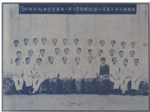
图6 1914年苏州地区女学生着装