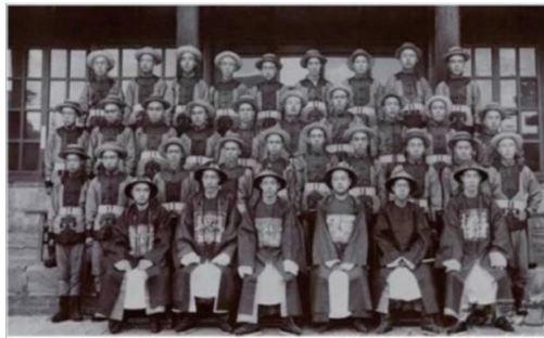
图3 山西大学堂学生穿着操衣