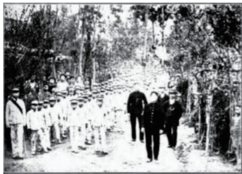
图4 四川省立中城小学学生野外操练