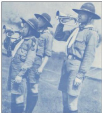
图 10 男童子军制服

1937 年修正的《学生制服规程》则更注重塑造完整的学生着装形象,弥补了 1929 年规程中女学生帽饰稀缺的问题,且为适应课程改革需求,增加了童子军制服和军训式制服。童子军制服分为男、女两式,男生着裤,女生着裙……男女上衣均为西式连领式样,两肩各设肩章带,胸前设两个带盖口袋。颈部系领巾,头戴圆形大檐帽 [16] ,具体如图 10 和图 11 所示。军训式制服依据高中以上学校军事管理办法,衣裤采用中山装,帽子为新式学生软胎帽,绑腿配黑色袜和短筒树胶运动鞋(见图 12)。