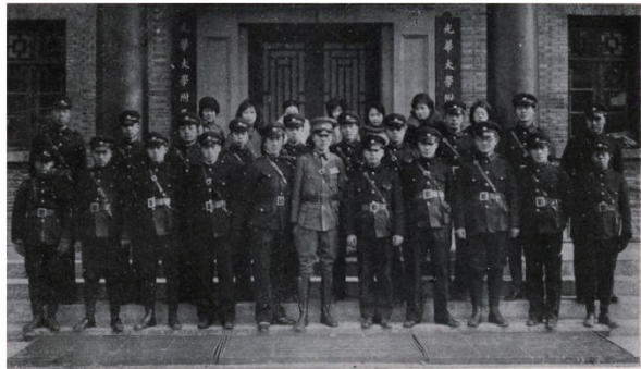
图 12 光华大学军事训练