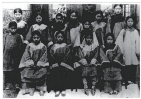
图5 1910年山东官立女子师范学堂女生着装

女子常服指传统袄裙和袄裤,但区别于《女学服色章程》中“袖口及大襟均加以缘,缘之宽以一寸为度” [14] 的要求,此时期女学生制服取消缘饰,且在长度和宽度上均有变化,整体呈现整洁朴素的风格。图5和图6为民国成立前后女学生着装对比。