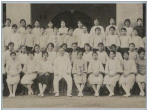
图 9 衫裙和旗袍式制服