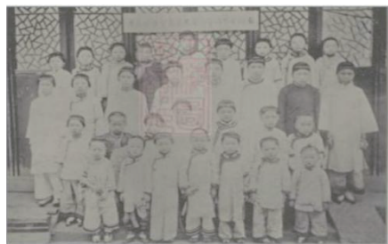
图2 1904年石门女学讲习所学生摄影