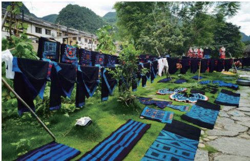
图 7 服饰晾晒场景

白裤瑶粘膏防染服饰在晾晒过程中,会形成特殊的艺术环境及意境。由于居住在缺水山区,族人会采用集中浣洗、规模晾晒的集体劳作模式,当数百件服饰在晒场同步展开时,“铺天盖地”的晾晒物构成震撼的视觉奇观(见图7)。背牌衣的方圆造型暗合天地之道,百褶裙的放射状褶皱呼应山川纹理,经日光晕染的植物染料更在织物表面投射出渐变的光影韵律。这种将生存智慧转化为审美表达的晾晒仪式,已然成为该族群独特的文化地理标识。