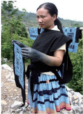
图 5 白裤瑶女子服饰 Fig. 5 Baiku Yao women's clothing

25 cm 的百褶短裙,行动时也会时遮时露,造成视觉上的诱目性与神秘感。但该现象并非为美而露,也不是现代意义的情欲展露,而是古代服饰形制简朴的体现 [10] ,反映了白裤瑶原始的母性生殖崇拜。可见白裤瑶服饰不仅传承和延续着古老的习惯和审美观念,还保留着对人体神秘性的原始认识。这种服饰结构设计既源于适应山地劳作与湿热气候的功能需求,又超越实用主义范畴形成文化符号系统。其遮蔽与裸露的辩证关系,在功能性需求、图腾信仰、审美意识与礼俗规约的多维交织中,构成了族群身份标识的符号系统。