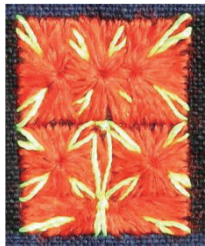
图 2 “鸡仔花”图案

大胆变形、巧妙夸张的艺术表现形式,达到简洁与繁复的共生、主观想象与客观形象的统一、情与景的融合、同类与异类形态的综合,具有极强的艺术张力。