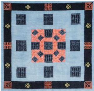
图 4 色彩对比 Fig. 4 Color contrast

而装饰图案却通过高纯度色彩的精密排布,在含蓄的视觉叙事中迸发惊艳的审美张力,这种沉稳与艳丽的对比形成了白裤瑶服饰色彩的特性、韵律与意境 [8] 。