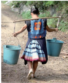
图 6 白裤瑶女子常装

防染技艺以制备婚服;婚礼仪式上新娘身着亲手缝制的嫁衣,既展现精湛的工艺智慧,又承载家族殷实的物质象征;直至生命终结,白裤瑶人仍覆盖粘膏防染背牌入殓,延续族群特有的文化符号。白裤瑶常装用于日常和劳动,图案简单、古朴大方(见图6);盛装则在婚礼、葬礼或节日场合穿着,其图案繁复华美,与仪典氛围相得益彰。这种植根于族群生存智慧的艺术创造,通过视觉符号系统构建集体记忆,在强化社群认同、维系族群凝聚力方面发挥着不可替代的文化功能。因此,白裤瑶人始终恪守传统服饰制度,其服饰作为活态传承的文化符号,既反映了族群的审美范式,又铭刻着民族的历史文化基因,最终,通过服饰符号使族群的归属感与文化向心力得以持续性强化。