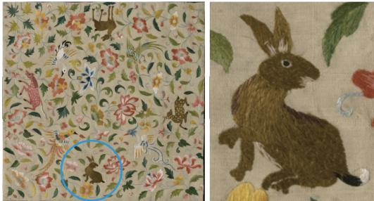
图 8 动物花鸟刺绣

时,往往整体构图布局均衡,体现和谐共生之美。如美国纽约大都会博物馆馆藏的动物花鸟刺绣(见图 8),白色平纹地上绣有半坐状灰褐色兔,与带有异域风格的动物穿插于花卉中。美国费城艺术博物馆所珍藏的《宋高僧传卷:第十七》封面纹样,融合了仙鹤、兔子和莲花等吉祥图案,这些元素在明代佛教兴盛时期体现着当时的文化潮流(见图 9)。早期,白兔因其稀有性而被视为瑞兽,但随着人类成功将其驯化,作为祥瑞的白兔地位也逐渐下降。在随后的节庆纹样中,兔纹所占比例愈发微小,成为龙凤等大瑞动物的陪衬。