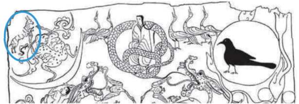
图1 长沙马王堆1号西汉墓出土T形帛画局部线描图 Fig.1 T-shaped silk painting with a partial line drawing excavated from tomb No. 1 of Mawangdui, Changsha, from the Western Han Dynasty

《淮南子》卷7《精神训》中所载“日中有蹲乌,而月中有蟾蜍” [11] ;《灵宪》所载“月者,阴精,积而成兽,像蛤兔焉” [12] ;在长沙马王堆1号西汉墓出土T形帛画上部的日月图案里,金乌立于日中,蟾蜍伴白兔于月中(见图1 [13] )。由此可知,在汉代乌鸟与蟾蜍、兔的组合形式已与日月产生联系。遵从阴阳对立并存的理念,金乌、月兔与蟾蜍就成为阴阳的典型代表符号。随着时间发展,蟾蜍被弱化,最终形成阳精之宗——三足金乌,阴精之宗——捣药白兔的固定搭配。美国私人收藏中有一件元代云龙纹胸背日月双肩织金大袖袍,双肩处有龙捧日月的图案,右肩为捣药玉兔,左肩为三足金乌(见图2 [14] )。