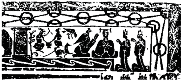
图 23 绥德四十里铺画像石拓片

捣药兔与长生之间有着密切联系,根据考古发现的画像石(见图 23 [39] )推断,捣药兔是西王母的重要伴侣和身份的象征。而“嫦娥奔月”的神话故事,进一步加强了玉兔与嫦娥之间的联系。因此玉兔的神性色彩被增强。