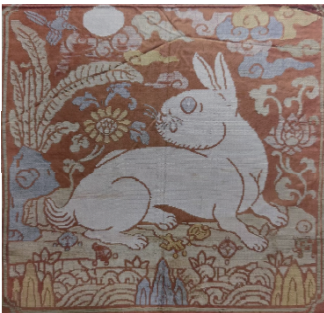
图3 玉兔喜鹊纹方补 Fig.3 Mandarin square of rabbit and magpie pattern

白兔因被视为祥瑞之兆而广受欢迎,且其本身具备完整寓意,因此在纺织品中也不乏独兔纹样,如在妆花玉兔喜鹊纹方补中出现了顾望姿态的独兔纹。独兔纹常被用于中秋佳节相关器物中,其以兔为视觉中心,兔的体量最大,且刻画精细,并与圆月、菊花这类节日性元素相呼应(见图3 [15] )。但当独兔为皇家所用时,通常会将皇家元素放大作为主体,兔纹则被缩小置于角落。如洒线绣坐龙袖片(见图4 [16] ),兔纹位于整幅纹样下部,其为配合龙的威严正脸,也为罕见的正面形象,构成画面中的视觉副中心。