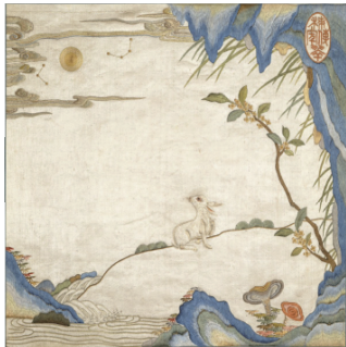
图 22 中秋月令丝绣玉兔望月方补

清朝时期,顾兔还被赋予眷恋、思恋的意思。故宫博物院藏乾隆时期的中秋月令方补如图 22 所示。该方补为白绸地彩绣,其上玉兔回首眺望,画面大量留白,显得祥和素雅,兔回首望月映衬出画面隐匿的思念之情 [34] 。这幅中秋月令方补延续了明代的顾兔形象,进一步丰富了顾兔的内涵。