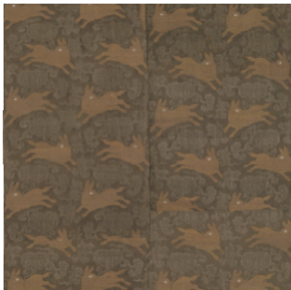
图 7 云兔纹锦