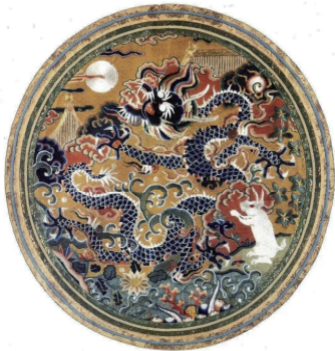
图10 云龙纹玉兔补子

2.1.1 玉兔 《隋书·礼仪志》载冕服纹饰:“山、龙九物各重行十二,织绣五色相错成文,九章而加日、月、星,足成古绣文十二章数” [19] 的冕服纹饰,象征着月的捣药兔被置于天子冕服肩膀处,成为华夏衣冠文化中不可或缺的部分。《太平御览·地部·卷3》引《外国图》曰:“西王母国前弱水,中有玉山白兔” [20] ,据此可推断大约在唐代,这类捣药兔形就已被命名为玉兔。《明宫史》卷3叙述“自端阳无毒至八月月仙玉兔俱有蟒纱” [21] ,其中指出中秋应景图案为嫦娥玉兔纹样。皇帝御用服饰亦设有应景图案,但更加强调皇家元素,因此龙凤图案占据主要位置,同时将体量减弱的玉兔等元素置于边缘。如明万历年时期的云龙纹玉兔补子(见图10 [22] )中龙纹为主体占据中心位置,玉兔、月、月宫、桂花置于边缘也增添了时令氛围。该补子中虽没有直接描绘舂捣工具,但其兔子捣药之姿,与库珀·休伊特史密森尼设计博物馆馆藏的明代月宫补子(见图11)上呈现捣药兔形象极为相似,兔生白毛、耳细长而立、站立抬爪、尾巴呈水滴状且上翘。捣药玉兔的形象在保持兔子原有的长耳、三瓣嘴、短尾等特征的同时,融入了类似人类舂捣药材的动作。