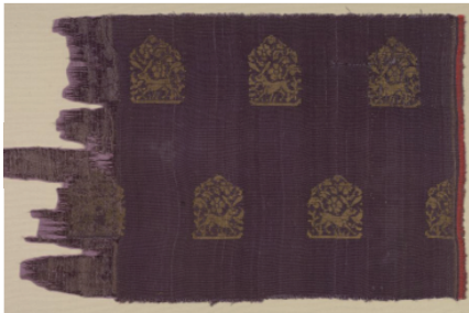
图 5 野兔纹锦

多兔组合常为两两错排的团窠图案,通常经向为同一组合图案的循环,纵向为外轮廓相似、内部主体不同或相同但朝向相反的纹样循环,这类排列形式在辽宋时渐渐开始流行 [17] ,多见于印金和织金织物中 [18] 。美国克利夫兰艺术博物馆馆藏野兔纹锦如图 5 所示,图 5 中兔纹为二二错位排列,但是围绕每一只兔纹增加了一圈花草装饰图案,这种方式在元代比较常见,并且在明代此类排列方式依旧广为流行,如故宫博物院院藏明宣德黄地桂兔纹妆花纱(见图 6)。还有一类是奔跑方向一致的兔纹,但相近行间的兔头朝向相反,如美国纽约大都会艺术博物馆馆藏云兔纹锦等(见图 7)。