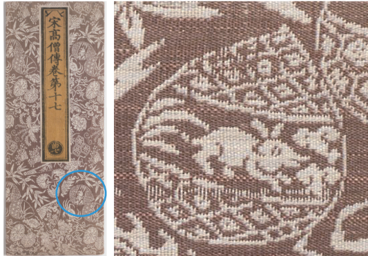
图 9 带有兔纹的经文封面