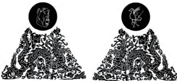
图2 元代云龙纹胸背日月双肩织金大绣袍肩部纹样 Fig.2 Shoulder pattern of a golden embroidered robe with cloud and dragon motifs, featuring the sun and moon on the chest and back, from the Yuan Dynasty