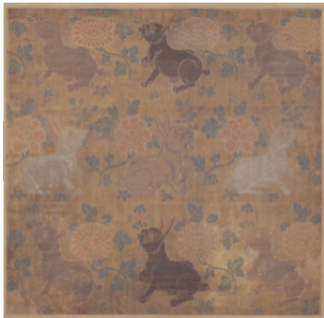
图 6 黄地桂兔纹妆花纱