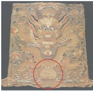
图4 洒线绣坐龙袖片 Fig.4 A piece of sleeve with scattered thread embroidery of sitting dragon pattern