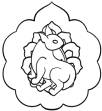
(a) 实物 (b) 细描纹样 图20 滴珠窠兔纹织金锦 Fig. 20 Cloth of gold with a rabbit in teardrop medalion patterns

明妆花玉兔喜鹊纹方补如图21所示。图21中，白兔是画面的主体，占据了近一半的面积，并且其回眸的姿态被描绘得十分细致，兔眼圆润、兔耳竖起，还增加了耳廓、兔唇、兔尾的细节。此处的兔子反顾时视线大胆上扬望月，并配以杂宝、祥云 [32] 等纹样表达吉祥的内涵。明代“望月兔”的内涵已与元代大相径庭，《正字通》卷一记载，“鸟多左顾朝阳也，兽多右顾望月也，兔反顾而左月出” [33] ，即鸟朝左望太阳升起，大多数兽类右顾望月，唯兔子不从众，以反顾之姿远望“月出”。因此元代“撑目兔”的说法基本被“反顾兔”替代，“望月”也由贬义转为褒义。