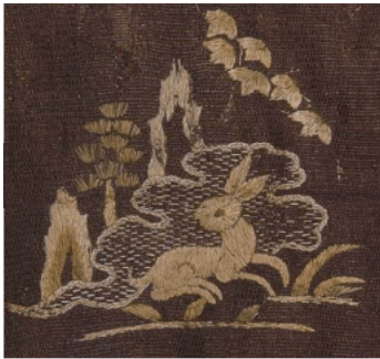
图19 棕色罗花鸟绣夹衫上的脱兔形象 Fig. 19 Rabbit on the embroidery jacket of brown simple gauze with birds and flowers patterns