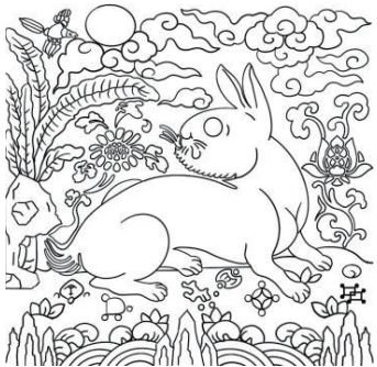
图21 玉兔喜鹊纹方补线描纹样 Fig. 21 Mandarin square with rabbit and magpie pattern

明妆花玉兔喜鹊纹方补如图21所示。图21中，白兔是画面的主体，占据了近一半的面积，并且其回眸的姿态被描绘得十分细致，兔眼圆润、兔耳竖起，还增加了耳廓、兔唇、兔尾的细节。此处的兔子反顾时视线大胆上扬望月，并配以杂宝、祥云 [32] 等纹样表达吉祥的内涵。明代“望月兔”的内涵已与元代大相径庭，《正字通》卷一记载，“鸟多左顾朝阳也，兽多右顾望月也，兔反顾而左月出” [33] ，即鸟朝左望太阳升起，大多数兽类右顾望月，唯兔子不从众，以反顾之姿远望“月出”。因此元代“撑目兔”的说法基本被“反顾兔”替代，“望月”也由贬义转为褒义。