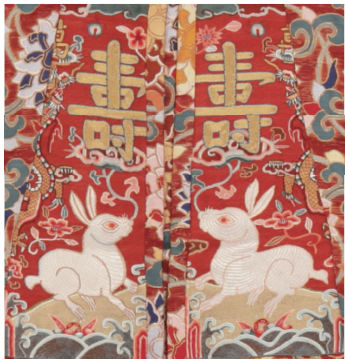
图18 织金缠枝莲妆花纱“玉兔万寿”补方领女夹衣 Fig. 18 Mandarin square with pattern of "jade rabbit pray for longevity" from a lined coat made of simple gauze and ornamented with brocaded gold scrolling lotus

2.3.1 正视兔 《抱朴子·内篇》提及“虎及鹿、兔，皆寿千岁，寿满五百岁者，其毛色白” [28-29] ，意思是说虎、鹿、兔都有可能活至千年，当它们活到500岁时，体毛颜色就会为白色，因此白兔被视作长寿的象征，常与灵芝、“寿”字组合。定陵出土的织金缠枝莲妆花纱“玉兔万寿”补方领女夹衣如图18所示。该衣为对襟方领，于前胸、后背缀有梯形方补，胸补分为两片，分别绣有一只白兔，两兔相对而望，略昂首、口衔灵芝，灵芝之上托盘金“寿”字。图18中夹衣应为孝靖皇后在明神宗万寿节期间穿着，因明神宗生日在中秋节前后，另因明代有按照节令更换服装的制度，作为中秋的视觉符号及代表祝寿心意的白兔成为画龙点睛之笔。文中将这类两耳竖起、呈半坐态、前腿伸直、后腿蹲踞，眼睛直视前方或向上斜视形象的兔子称为正视兔。