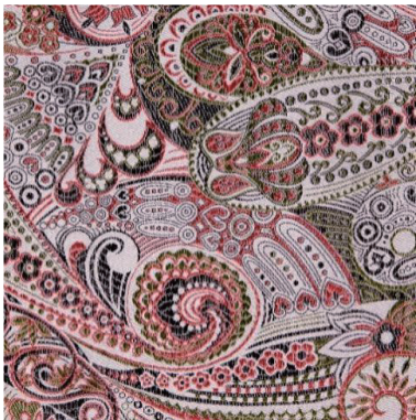
图 6 1982 年以佩兹利纹样为题材的花卉古香缎(花号:2041)

20 世纪 70 年代以后,花卉古香缎的设计元素发生了较大变化,除了一般的传统花卉题材外,国外流行的装饰纹样也得到广泛运用,如佩兹利纹样(俗称火腿)、和式纹样及东欧民族纹样等(见图 6 和图 7)的运用,不仅使花卉古香缎设计元素的范围得到拓展,其创新的花色品种也受到苏联和东欧国家的青睐,并持续获得大量订单,促使此类产品得到迅速发展。