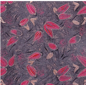
(d) 1982年以似花非花形态为叙事方式的花卉古香缎（花号缺失）