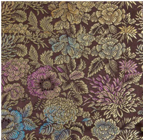
(a) 1982年以光影结构为叙事方式的花卉古香缎（花号：2012-2）

和现代设计语境,特别是一些似花非花、似叶非叶的元素,新颖生动的造型,错落有致的形式变化,充满了浪漫和清新雅致的情调,部分符合了西方服饰流行趋势的需求[见图 11(c)和(d)]。同样,在色彩运用上,花卉古香缎纹样从花卉结构出发,以色相不同、明度接近的方法进行配置,改变了传统双构平涂、单色或少数色成型的设计习惯,更趋近国际服饰面料时尚发展的潮流,开辟了丝织色彩设计的新纪元。