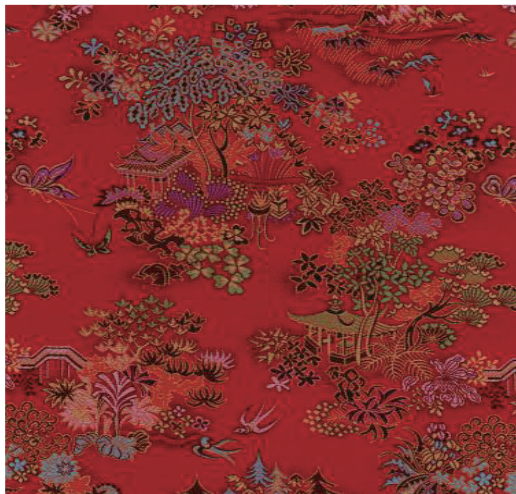
(b) 1982年以亭台楼阁小桥流水为叙事主题 (花号: 1025)