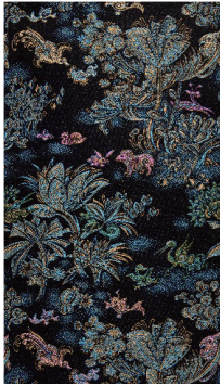
(a) 1983年以动物与森林为叙事主题的古香缎（花号：1022-3）