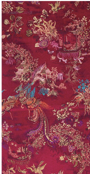
(b) 1983年以凤凰、百鸟与建筑、旱船为叙事主题的古香缎（花号：1009-4）