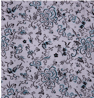
图 4 1982 年以牡丹、寿桃、佛手为题材的传统类花卉古香缎(花号:581)

花卉古香缎,以写实或装饰类花卉为主要元素,布局以满地或半清地为多(传统织锦缎一般以清地为主)。在装饰风格上除了承袭传统丝织产品的特征外,同时也间接受到绘画、刺绣、缂丝等影响。传统类花卉古香缎纹样以梅、兰、竹、菊、月季、牡丹、唐草等为主要元素,并结合圆寿纹、格形、迴纹以及龙、凤、蝙蝠、鹤、麒麟、狮子、鹿、象等纹样,表达吉祥、喜庆的寓意(见图 4)。在传统宋锦基础上进行创新设计的纹样也占有一定的比例,其灵活的装饰排列方式更符合人们现代生活方式的要求(见图 5),这类纹样在构图上,以 1~4 个散点构成单位纹较多,并以两大两小或两大一小的组合较为常见。