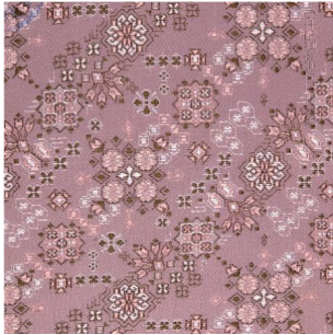
图 5 1982 年在传统宋锦基础上进行创新的花卉古香缎(花号:704)