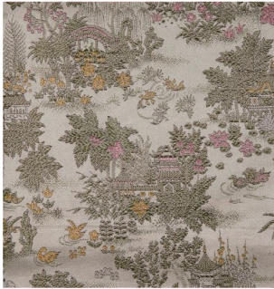
图 3 1982 年以傣族吊脚竹楼和西双版纳风情为题材的风景古香缎(花号:1011)