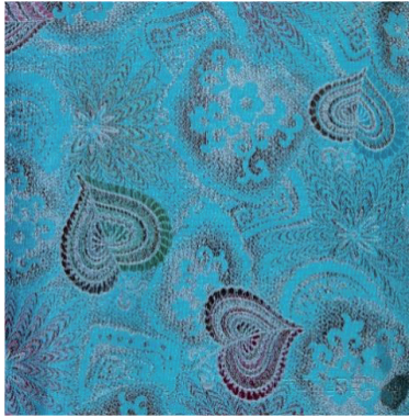
图 7 1982 年以和式纹样为题材的花卉古香缎(花号:625-107)