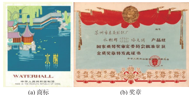
图 1 1981 年东吴丝织厂水榭牌塔夫绸荣获国家金质奖 Fig. 1 Certificate of the National Gold Medal were awarded to the Shuixie brand taffeta fabric of Dongwu Silk Weaving Factory in 1981

东吴丝织厂以生产塔夫绸、织锦缎、宋锦、织锦缎、古香缎、斜纹绸、大伟呢、和合绉、九亚缎、丁香缎、近芳缎等熟织产品为主。由于品种繁多、色泽鲜艳、花样别致、质地精美,产品畅销全国及海外一百多个国家和地区。1981 年,该厂生产的水榭牌塔夫绸产品(品号:12301,12302)获国家金质奖章(见图 1),织锦缎、古香缎、克利缎、金玉缎、宋锦、织锦被面等先后荣获省优质产品称号。