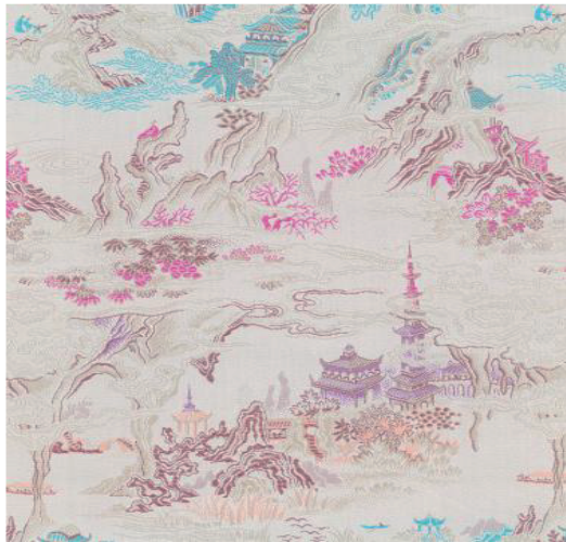
(a) 1982年以烟雨古寺为叙事主体 (花号: 1014)