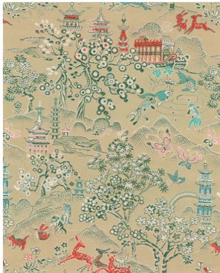
(b) 1982年以动物为主体的世俗主题古香缎 (花号: 1021)