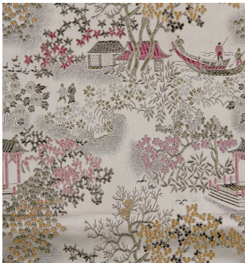
(a) 1988年以人物为主体的世俗古香缎 (花号: 外001)