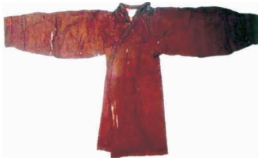
图 1 小菱形纹锦面绵袍

湖北省江陵县的马山 1 号楚墓出土了 7 件保存相对完整的袍服,其基本式样为交领右衽,直裾,长袖,上下分裁,腋下加“裆”,领口、衣襟和下摆处有缘饰 [7] 。小菱形纹锦面绵袍如图 1 [8] 所示。图 1 中腋下加“裆”结构的袍服是已出土袍服文物中独有的,并且尚未发掘出有该结构的中国古代服装。但历史文献中有记录相似的部位结构,《礼记·儒行》 [9] 中提道:“鲁哀公问于孔子曰:夫子之服,其儒服也?孔子对曰:丘少居鲁,衣逢腋之衣;居宋,冠章甫之冠。”此处的“逢腋”,即“缝腋”之意,根据文献记载时间可知,腋下加“裆”的样式结构在春秋时期的鲁国就已经出现。该结构又被称作“小腰”,先秦时期又称为“衽”,沈从文解释道:小腰在木器和建筑构件中有封合和拼装的嵌入作用,服装术语对其引用指一种方形的插片,嵌缝在两侧的腋下,即上衣、下裳、袖腋 3 处交界的缝际间,类似现代连袖服装的袖底插角 [10] ,具体如图 2 所示。