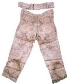
图 3 鲁荒王墓出土男裤 Fig. 3 Men's pants from cemetery of LuHuangwang

山东鲁荒王墓出土男裤如图 3 [17] 所示。《鲁荒王墓》 [17] 中对其的描述是: “裤腿前后片通裁, 从裤腿内缝处向外对折, 在腿外侧接缝上半部, 前后各接一上宽下尖的锥形接片, 将外侧连缀, 将两腿前后片分别在裆部缝合, 形成整条裤。”鲁荒王墓出土男裤结构如图 4 所示。两腿上半部分的三角补缀结构, 增加了胯部的松量, 使人体活动时不至于太拘束, 该结构以最小的布幅解决了胯部用量大的人体机能需求, 使裤子更加适体。这种巧妙又简单的方法使制衣变得更为容易, 同时节约了布料, 具有一定的普适性。