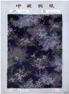
(a) 1963年中国丝绸公司织锦缎样本