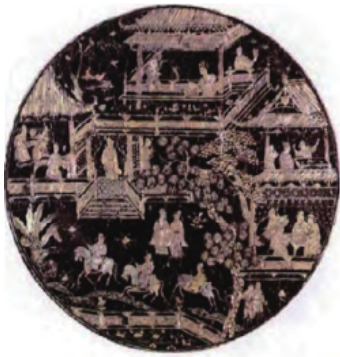
图 1 元代楼阁人物螺钿盒 Fig. 1 Mother-of-pearl box with pavilion and figure pattern in Yuan Dynasty

收藏于日本神户白鹤美术馆,盒上的装饰纹样与界画中的纹样颇为接近,甚至描绘景色的精细程度超过界画。王佐于明代天顺三年(1459 年)校增《新格古要论》,其中《螺钿》一项有记载:“元时富家不限年月,做造漆坚而人物可爱。” [12] 该文献对螺钿上人物图案装饰技法的流行情况进行了很好地表述。