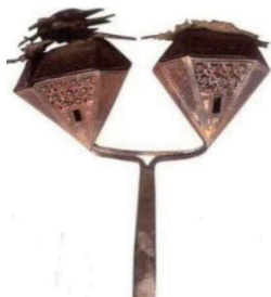
图3 银鎏金并头楼阁簪

中国古代的金银制造工艺经过宋元时期的高速发展,在明代达到了鼎盛。银匠们在制作金银首饰方面,无论是题材内容、表现手法还是工艺运用都达到了炉火纯青、出神入化的地步,风格也日趋多元化。其中明代楼阁人物簪钗的制作主要采用累丝、镶嵌、锤鍍、篆刻等工艺,并以掐丝、填丝、焊接等技法为辅助,楼台层叠,花草环绕,各色人物居其中,体现了银匠们娴熟的技艺和高超的水平。关于楼阁题材在金银簪钗上的应用最早见于浙江永嘉南宋窖藏中的唐代银鎏金并头楼阁簪(见图3 [1] ),其造型别致,是取楼阁之象而加以夸张、装饰和变形,与明代墓葬出土的簪钗类型风格迥异,且图案纹样和制作工艺略显单一。元代也多有镂空雕鎏的簪钗,如螭虎簪,钗上有花朵,下有口衔花叶的扭结双龙或双虎,略做雕琢,并不细致;又有荔枝簪、瓜头簪、如意簪等。株洲攸县丫江桥元代窖藏曾出土了1支金海水蛟龙纹如意簪(见图4 [1] ),簪首底为水花海浪,上面一对蛟龙相呼应,蛟龙尾上托火珠并朝同一方向排列,呈现出立体效果,该簪是利用锤鍍技术将两片金片打造成两个蛟龙的侧面,再将其焊接到一起形成一个整体。元代精妙的锤鍍工艺使得纹饰呈现出浮雕效果,但与明代用累丝、镶嵌工艺制成的立体簪钗相比缺少轻巧灵动性。