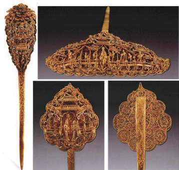
图6 夏彝墓楼阁人物簪钗

据出土墓志载:“陆润成化丙戌(1466年)登进士第,官至温州四品知府,妻马安人,讳素净……太守公擢知温州郡,俸入稍裕,安人不以富贵易节。” [2] 其出土的“瀛洲学士”金掩鬓,云纹形状上镌刻出重檐楼阁及人物动态,略有浮雕的效果,并不华丽繁复,这便与陆润妻马安人不以富贵易节的操守相呼应和印证。夏彝虽为六品知县,但在物质层面上颇有倚仗,长泾夏氏家族是富甲一方的江南望族,与长泾经济、文化、社会等方面有着千丝万缕的联系,因此,夏彝墓出土的楼阁人物簪钗(见图6 [22] )做工繁缛也不足为奇。夏彝墓出土簪钗有桃形、山形及艾叶形,采用镌刻、焊接、累丝缠绕等工艺制成,方寸之间楼阁屹立,花草点缀,人物神态各异。夏彝虽心存僭越,但在不违反禁令的前提下,官阶品级较低者也可拥有工艺质量较高的作品。与这批楼阁人物簪钗一同出土的还有一对戗金人物花卉漆盒,盒上有女子庭院书写和下棋的景象,整体画面细致生动,这些作品都反映了夏彝“于势力纷华澹然无好,顾独好古名画书帖器玩必捐重价购之”的志趣。