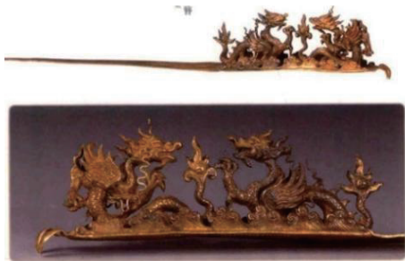
图4 金海水蛟龙纹如意簪