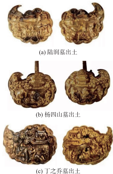
图7 楼阁人物金掩鬓

成元素,云朵形簪首上以浅浮雕和中浮雕为主的制造工艺,簪首底部均为实心,由此推断这3对簪钗制作年份应该非常相近,墓主人身份等级也差距不大。相比之下,重庆江北蹇义家族墓出土的一支“瀛洲学士图”金掩鬓最为精致(见图8 [3] ),簪首采用3层叠焊的方式形成纵深的远中近景,运用了篆刻、镂、累丝、焊接等工艺在6 cm的空间内设置了楼阁、人物与花木。“瀛洲学士图”设计主题来源于唐代的历史故事,与其发展而来的各类学士故事图符合官方政治教化的需求,因此得以传播流通。常熟市西门外程家坟出土的一对金掩鬓,两支簪首上故事内容并不相同,各自装饰着“相如题桥”“赐送莲炬”的历史故事,一方面反映的是求学之人对锦绣前程的向往之心,另一方面也是对皇权的歌颂 [2] 。从使用人群看,佩戴者多为官宦阶层妇女,这一男性化题材在簪钗上的应用体现了夫妇一体、荣辱与共的夫妻情分。