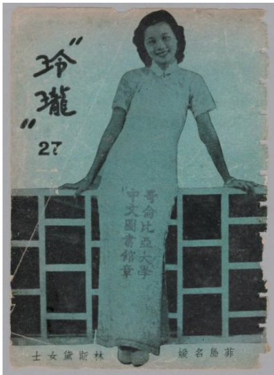
图 8 身着开叉旗袍的名媛