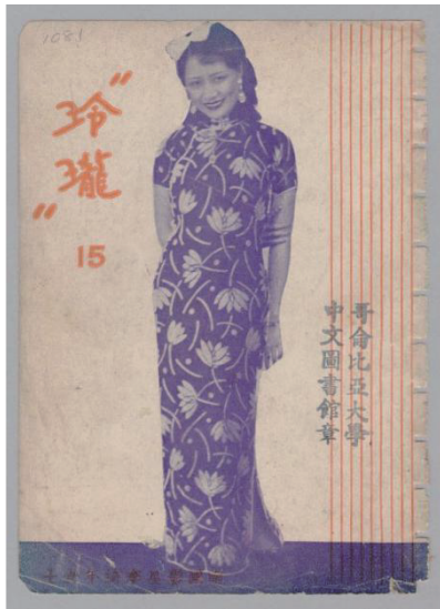
图 9 身着改良旗袍的女性

《玲瓏》杂志中穿着改良旗袍的女性多为新时代知识女性,她们通过穿衣方式打破了封建保守思想,她们既是改良旗袍的穿着者,也是改良旗袍的塑造者,体现出女性意识觉醒以及当时上海新女性对自由、平等、民主的渴望。图 9 [42] 为民国女星李绮年女士。她笑容甜美,烫着时髦卷发,身穿合身短袖开衩长旗袍,袍身纹样是当时流行的植物花卉纹样,袖口、下摆处有镶边装饰,给人以自信从容、不拘小节的感觉。女明星在当时作为时尚群体之一,引领了民国女性的潮流风尚,将其美好形象刊登于《玲瓏》杂志封面,有助于激励民国女性勇敢踏入社会,以寻求自我价值。