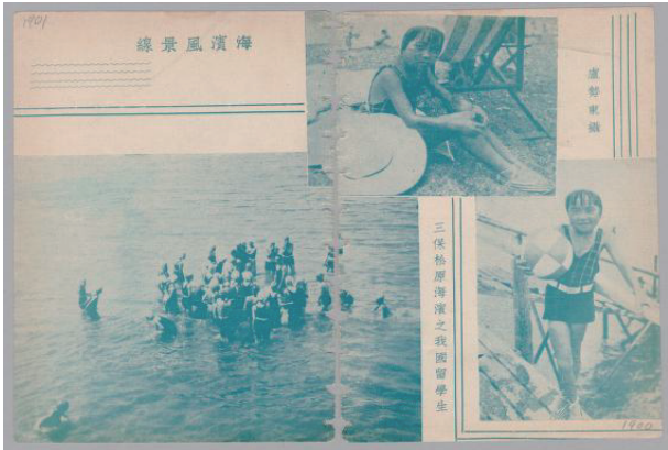
图 3 《玲珑》杂志中有关运动的照片