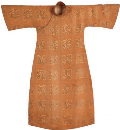
图 7 鹅黄色方格卷草纹提花绸侧开立领倒大袖旗袍