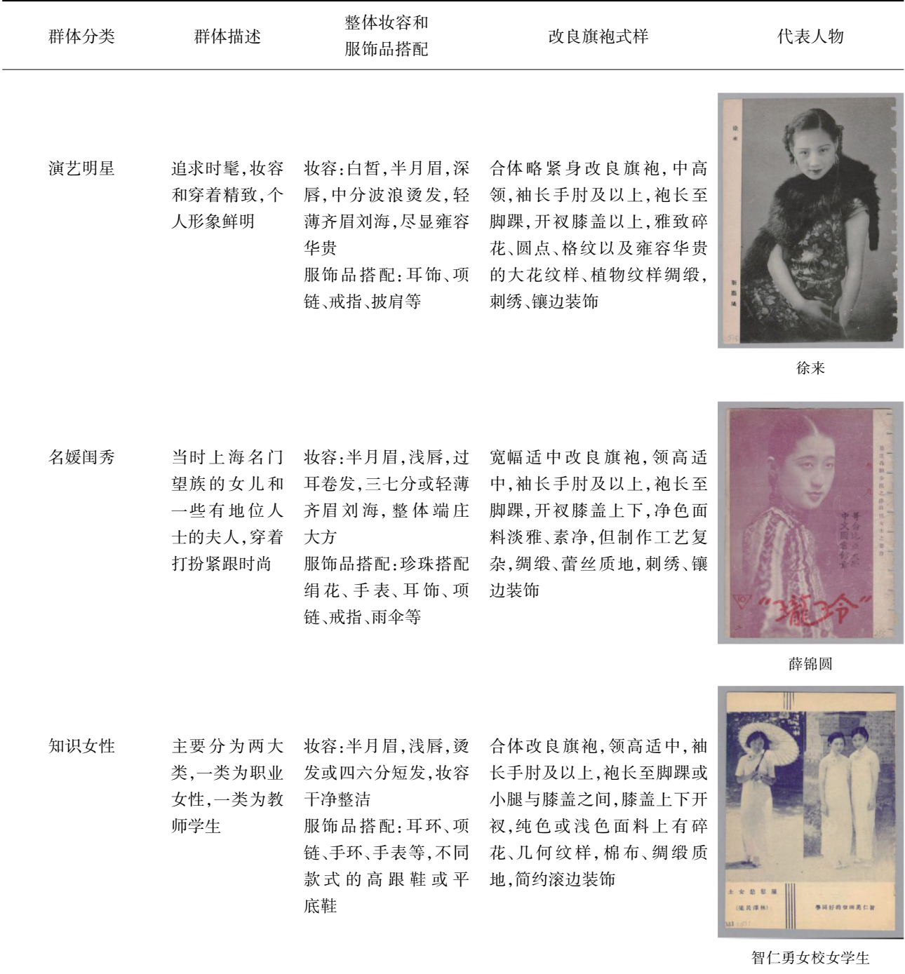
表 1 《玲珑》杂志中的摩登女郎分析 Tab.1 Analysis of modern lady in LinLoon

《玲珑》杂志自创刊以来,共出现2 000多个女性形象,其中身着改良旗袍的女性形象有 1 600 多个,提取其中部分女性进行归纳分析,将其划分为演艺明星、名媛闺秀、知识女性 3 类。《玲珑》杂志中的摩登女郎分析见表 1 [16-22] 。