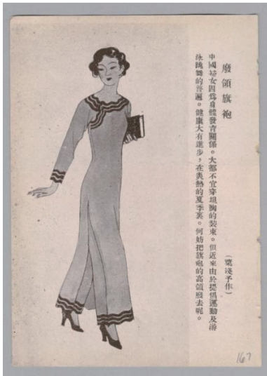
图 6 叶浅予所绘的无领改良旗袍

注“近来由于提倡运动及游泳跳舞的普遍,健康大有进步”的设计说明。此外,当时的旗袍剪裁非常贴合身体,侧摆无开衩或开衩小,脚步摆动幅度受限,出行极不方便,加之当时运动与健美思潮盛行,于是设计师在下摆处增加开衩设计并加深了开衩长度。20 世纪 20 年代末旗袍如图 7 [39] 所示。该款旗袍为 A 字形大身轮廓、衣身前后均有中缝、倒大袖、侧缝无开衩。图 8 [40] 为 20 世纪 30 年代身着改良旗袍的非岛名媛林斯黛女士。其所穿着的改良旗袍有着明显的高开衩设计,相较于无开衩设计的贴身旗袍,高开叉旗袍更便于日常穿着与行走,同时高开衩设计也符合当时流行的健康美 [41] 。