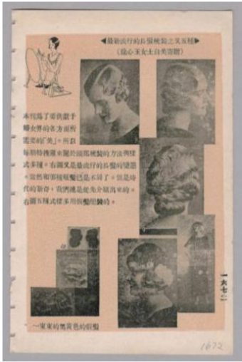
图 2 欧美时尚发型