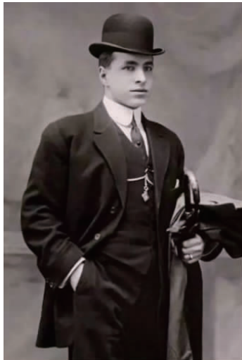
图 1 英国绅士 3 件套

用(见图 1 [8] ),之后逐步衍生为西装原型“long suit”,直到 1930 年被视为商务场合穿着的正式服装 [9] 。中国现代男性商务职业装的开端,是改革开放后文职人员的工作服装开始采用西服、衬衫、领带、皮鞋等新样式,并且统一了着装的款式、颜色、质地及品牌 [10] ,因此,穿着这类服装的群体又被称为“白领”(见图 2 [11] )。现代女性商务职业装则起源于民国时期,当时女子服装的主要款式是“上衣下裙式”和“衣裙连属式”,这两种款式经过时代的变迁逐渐演化成现代女性商务职业装的基础款,主要呈现为西服套裙(或裤)配衬衫的模式(1 衣 1 裙配衬衫的 3 件套或 1 衣 1 裙 1 裤配衬衫的 4 件套),也有西服搭配连衣裙的 2 件套模式。