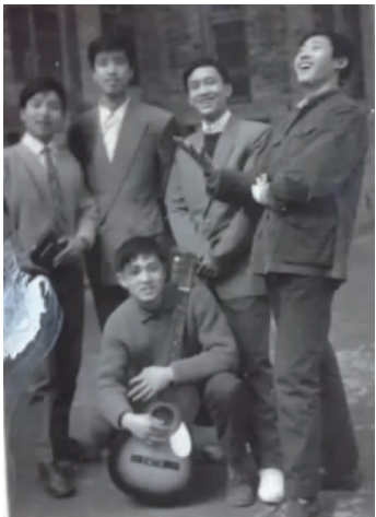
图 2 1978 年后的中国“白领”