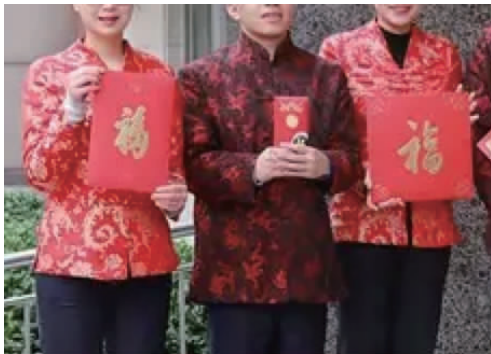
图 4 2016 年中国银行某分行新年职业装 Fig.4 New year business attire of a branch of BOC in 2016

近年来,商务职业装的制作工艺逐渐精细、丰富,如西服工艺中的枪柄式褂面、手机袋防辐射工艺、弧形手巾袋工艺、半毛衬工艺、D 型套结工艺等;西裤工艺中的防拱门襟拉链、永久挺缝工艺、内置伸缩腰工艺、裤脚口防踩条工艺、弧形腰工艺等;西裙工艺中的网眼里布工艺、裙衩防撕裂缝制工艺等;衬衫工艺中的抗皱防缩工艺、领角插片工艺、下摆防卷边工艺、无甲醛成衣免烫工艺、银离子抗菌工艺等。目前,许多职业装制造企业申请了能够提