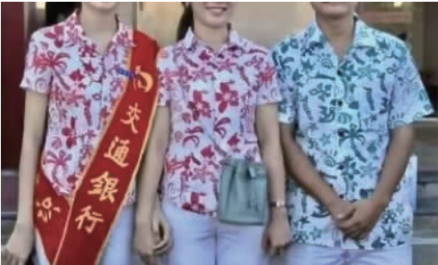
图 3 2013 年交通银行海南某支行周末职业装 Fig.3 Weekend business attire of a branch of Hainan BCM in 2013

繁的行业(如金融、房地产等),这类行业的职业装基本遵循西服+衬衫+西裤(西裙)3件套或者西服+衬衫+西裤(西裙)+马甲4件套的配置;部分女性商务职业装会搭配连衣裙,夏季女装有短袖套裙(短袖西服类别);常规配饰包括丝巾、领带、领花、头花、腰带、胸针等,整体搭配正式严谨。还有一些企业或事业单位将地域或礼俗特色融入商务职业装中,增添其趣味性与时尚性,如2013年交通银行海南某支行的周末职业装,女装为大花衬衫,男装为绿色衬衫,均配以白色休闲裤,充分体现了海南岛的地域风情(见图3 [20] );2016年中国银行某分行春节期间的商务职业装为新年开门红唐装(见图4 [21] ),通过服饰营造出传统节日气氛,提高了整体营销宣传效果。