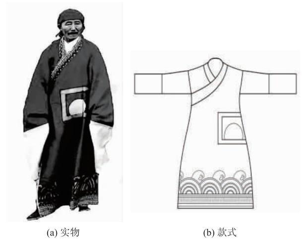
图 3 傩衣 Fig.3 Nuo clothes

符号形式代代相传。另外,傩戏头饰主要为巾帽,式样简洁,便于系戴,形制以明朝巾帽中的结巾、四周巾和网巾为主。池州傩戏服饰主要为平面造型,依据角色组合搭配。近现代以来傩服饰在一定程度上受戏曲服饰的影响,出现了蟒、褶、靠等新的样式,如刘街乡姚街祠堂内的傩戏服饰概况见表 1。