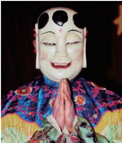
图 1 傩戏表演者 Fig. 1 Nuo opera performer

服饰的扮装拟态功能给予表演者一种神圣而又独特的话语权。早期的傩通常借助夸张的面具和皮毛模仿神话传说中具有超能力的动物,营造一种恐怖的气氛来表达人们内心狰狞、恐惧的情绪,达到驱鬼辟邪的目的。在池州傩戏的搬演中,表演者头戴夸张面具,身穿五彩服饰,与神灵进行直接对话,如图 1 所示。随着经济的发展和人们生活水平的提高,传统的宗族观被逐渐淡化,且由于傩戏传承人逐渐衰老,传统的傩戏信仰受到冲击。池州傩戏在这种现状下,某种程度上已成为一项乡村文化娱乐活动 [2] ,各宗族会从市场购买演出服饰,甚至相互攀比,服饰款式更加丰富,色彩更加华丽,并且主要看重舞台表现力。近年来,池州傩戏经过不断创作与创新,已经走出乡村登上专业舞台,获得更多人的喜爱与称赞,傩戏服饰在这样的环境下发挥着娱乐审美的作用。总体而言,池州傩戏服饰的功能体现在扮装拟态和娱乐审美两方面。