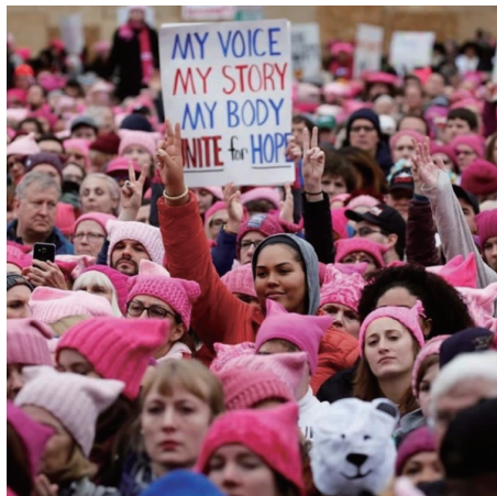
图5 “粉红猫咪帽”运动

女子相对更为感性,其人格特质在社会协调、情感社交的互动中构建。当下的中国正经历着从生产型社会向消费型社会转型的阶段,在西方时尚潮流、消费主义、后现代审美理念与后现代女性主义影响下,中国女性服饰审美打开了新局面 [14] ,粉红色被赋予了性感、情色、同性恋文化、种族主义等多重定义。同时粉红色服饰也被当作女权主义运动中的视觉旗帜,粉红色已不再仅是一种服装色彩,更成为一种社会符号语言渗透到女权主义浪潮中(见图5)。