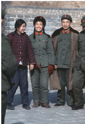
图1 20世纪60年代的中国女性服装

20世纪60年代的西方时尚圈掀起了一股“粉红色的新10年”潮流,Vogue杂志主编戴安娜·弗雷兰提出了“pink pink pink inside and out—in fashion, in beauty”的口号。玫瑰粉、珊瑚粉、蜜桃粉、烟熏粉……各种明度不一、冷暖各异的粉色充斥着女性服饰与化妆品市场 [10] 。而这场粉色风暴并没有吹向当时的中国,此时中国的女性服饰如李滨声的漫画《四季常青》中描写的一般:“桃花开了,姑娘穿蓝色;荷花开了,姑娘穿蓝色;菊花开了,姑娘穿蓝色;水仙花开了,姑娘穿蓝色。”“文化大革命”之下的中国女性服饰是一片蓝、绿、灰色军便装的海洋(见图1),粉嫩的花裙子只有在女学生身上偶见其风采,粉红色悄无声息地淹没在蓝、绿、灰的潮流中。