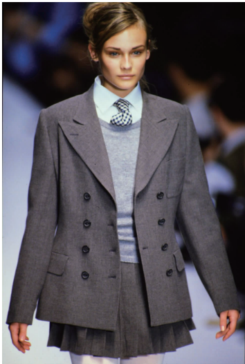
图 2 Gucci 1997 年春夏系列

花丛中的一抹粉红,不打眼却又不可缺。20 世纪 80 年代开始涌现出大量具有现代意识的职业女性,中性风格的女性服装逐渐出现 [11] ,这一时期的女性为打造出与以往不同的干练、成熟又时髦的形象,多选择极简主义风格的女性职业装,色彩沉稳低调(见图 2)。20 世纪 90 年代在极简主义风潮下,时尚界对粉红色的热情降低了 [12] 。