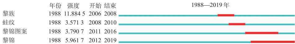
图 5 1988—2019 年海南服饰文化研究突现关键词 Fig.5 Key words of Hainan clothing culture research from 1988 to 2019

20 世纪 80 年代,在社会科学发展需求下,中国文化史与文化遗产的研究再次崛起 [4] 。尤其关于民族文化遗产内容与传承发展措施等具体问题 [5] ,学界在理论与实践方面均展开了深刻探讨。着眼于黎族独特的纺织文化,此类研究也逐渐从大范畴研究体系中细化,有助于探究黎族族群文化活动。如陈江通过对“岛夷”为何处,“卉服”为何物的思考,借助古文献与地方史志引证、对古代海南黎族纺织文化历史脉络进行梳理 [6] ;梁敏 [7] 、杨先保 [8] 等对作为技术传播角色的“黄道婆”是否曾拜学于黎人存疑,并以此为切入点推断和旁证宋元时期海南岛以及内陆棉纺织业的发展与关联。