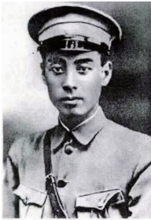
图 3 黄埔军校时期的周恩来