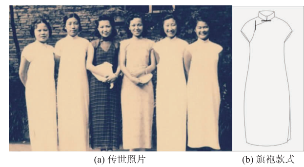
图 7 旗袍式校服 Fig. 7 Cheongsam school uniform