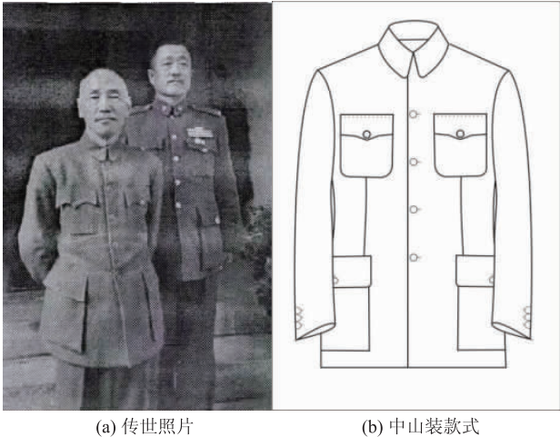
图 2 中西合璧式校服

上口袋为平贴袋,圆弧形的袋角;下口袋是“风琴袋”,有的会增加“工”字褶,可涨缩。4 个口袋均有袋盖,上袋盖为“笔架盖”,两边为弧形,中间是尖形,左边袋盖外侧开一个小孔,用于插笔;下袋盖呈长方形,上口袋的弧形中和了中山装直线条为主的刚毅、生硬感。与西服袖子相比,中山装的袖扣部位设有假扣眼,钉 3 粒扣。衣身前幅为左右两片,后幅为整片,不破缝,具体如图 2 所示。中山装大都为军校学生穿着,黄埔军校时期周恩来的制服就是采用此形制,如图 3 所示。