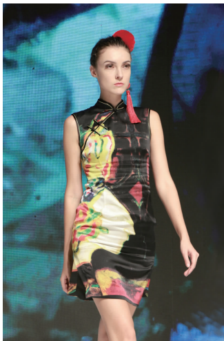
图4 笔者“绝代风华”皮影系列印花与瓯绣工艺表现作品

笔者对本土民间瓯绣工艺进行新民间时尚的创新,将传统皮影以当代艺术形式重构后转印到面料上,提取最有代表性的部分用瓯绣工艺表现。瓯绣多变的针法、生动的绣面和鲜艳的色泽,加强了图案的立体质感,丰富了面料的工艺表现,也使其更加富有民间意蕴和匠心(见图4)。本土非遗瓯绣工艺与世界非遗皮影艺术的碰撞,是对时尚皮影艺术的创新,具有高级定制的效果,并以新时代的工匠精神走入时尚领域,从民间到新民间,提高传统文化的推广价值。