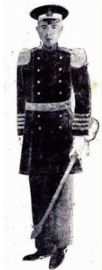
图 5 大礼服全身效果

1)警官服制。大礼服包括帽、衣、裤、鞋、礼带、礼刀等。其中:①帽子为黑色平顶大檐帽丝毛织品,附有帽徽、帽绊及帽章等,帽绊左右各有 1 粒金色圆纽;②衣服为黑色前开襟双排扣丝毛织品,其扣为金色圆形铜扣;③裤子为黑色丝毛织品,裤脚不翻边,左右各镶 1 道金线;④鞋子分为皮鞋与马靴 2 种,均采用黑色纹皮制成;⑤礼带宽 6.7 cm,以红缎为底色,带的一端附铜钩铜环,作为挂刀用;⑥礼刀由刀柄、刀身组成。大礼服全身效果如图 5 所示 [13] 。常礼服除肩章外与大礼服相同。