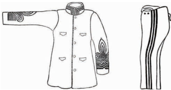
图2 清政府规定的西式警察服装衣和裤

帽顶略大于帽墙,前附有帽檐,此帽式一直沿用到民国时期,仅对帽章进行了替换;②上衣为立领前开襟,缀单排纽扣5粒,衣前身有4个有袋盖的口袋,衣身上缀有领章、肩章和袖章;③外套长度到膝盖,袖长到手腕,两排扣,每排6粒,左右各开1个斜的暗口袋;④裤为合体西式裤,侧缝处缀有裤章;⑤鞋分为筒高到踝骨的皮鞋和筒高到膝盖下方的长靴2种。西式警察服装衣和裤如图2所示 [5] 。