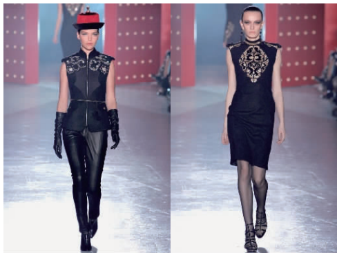
(b)清代服饰纹样的运用