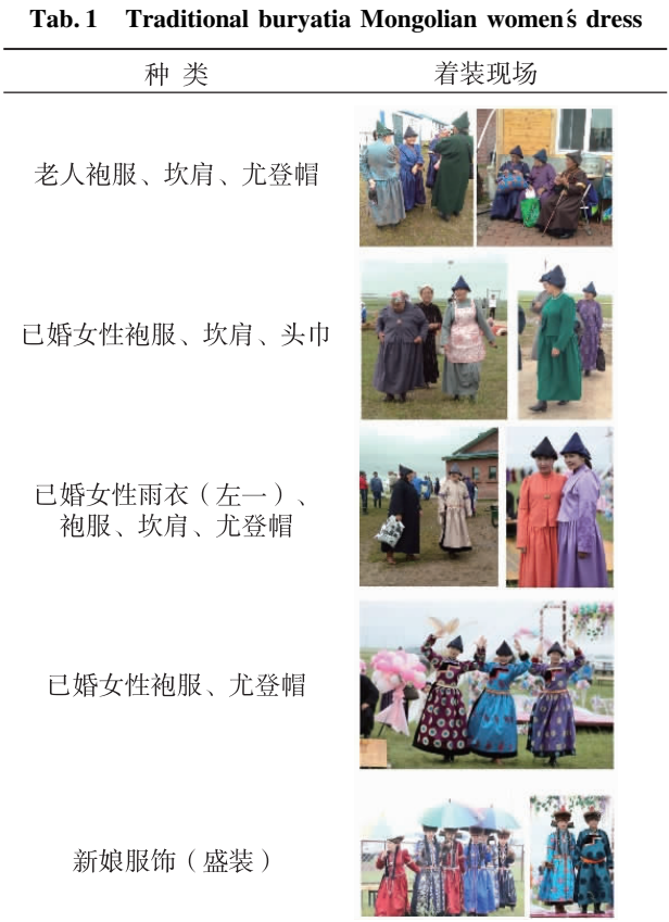
表 1 布里亚特蒙古族传统女装

布里亚特蒙古族已婚女性袍服为衣裙式结构,泡泡袖、立领、右衽大襟、腰部叠褶。为纪念族群英雄巴拉金皇后(历史上,巴拉金皇后被敌对分子肢解),在已婚女性袍服的肩、腰、肘处进行分割设计,体现出布里亚特蒙古族人 对英雄主义精神的崇尚。已婚女性袍服外通常搭配坎肩,坎肩形制与现代马