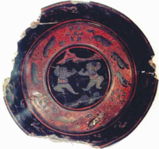
图 1 “童子对棍图”漆盘 Fig. 1 Paint tray of “boy-to-stick”

人物造像在中国有着悠久的历史。早在约 1 万年前,栖息在中华大地的先民已经懂得使用原始工具,他们将自身形象刻画于器皿上传诸后世 [7] 。童子纹作为人物纹样的重要组成部分,史料上并没有明确记载它的起源时间。考古发现,安徽马鞍山朱然墓出土的三国时期漆器中所绘“童子对棍图”,是迄今发现最早的孩童图形,具体如图 1 [8] 所示。图 1 中,山前空地上两个稚气十足的童子身穿肚兜,持棍对舞,充满浓郁的生活气息 [9] 。