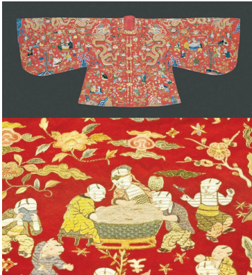
图 3 明代孝靖皇后洒线绣百子衣 Fig. 3 Xiaojing empress's embroidery clothes with a hundred boys in Ming Dynasty