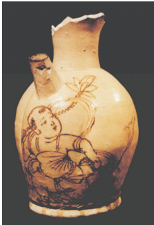
图 2 青釉褐彩童子持莲纹执壶 Fig. 2 Green glaze pot of boy holding lotus flower

随着社会的发展,童子纹不断演变,呈现出多元化的发展趋势。唐代,童子纹由抽象变为具象。图 2 [10] 为湖南长沙铜官窑发现的一件青釉褐彩童子持莲纹执壶,其运用写实手法描绘了一个身系肚兜、肩负莲枝、手挽飘带的胖娃娃,孩童人体比例准确,形态生动活泼。宋代,市民阶层逐步壮大,受风俗画“婴戏图”的影响,童子形象在织物、瓷器、玉器 etc 等工艺作品上的应用屡见不鲜,“婴戏纹”成为童子纹的主要表现题材,内容多反映孩子们嬉戏玩耍的场面,如放风筝、骑竹马、抽陀螺、攀树折花等,细腻地展现了孩童真实的生活状态。明清时期,童子纹的应用达到鼎盛,尤以众多孩童构成的“百子图”最为典型,具体如图 3 [11] 所示。孩童形象从最初的一两个发展到上百个,说明明清时期的童子纹强调热闹的场面,并被赋予了吉祥如意,象征着祥瑞之兆,因此得到上至帝王、下至平民百姓的普遍青睐 [12] 。近代,童子纹所呈现的主题越来越丰富,如“连生贵子”“葫芦生子”“麒麟送子”等纹样广泛应用于服装、帷幔、被面等面料中,寄托着祈子多福、求喜求乐的美好愿望,深受人们喜爱。通过对童子纹发展史的梳理,可以看出童子纹是历史的符号,在中国纹样史上流行近千年,它的盛行与人们生活方式的转变、社会文化的发展有密切关系。