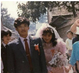
图 5 1989 年的婚礼现场

随着人们物质条件日益增长,婚服的花样也随之更加丰富,在色彩和风格上呈现多样化。其中在色彩上,抛弃了以往蓝、绿、灰的色彩限制,色彩明亮的“中山装”“干部装”或是崭新的棉服成为了人们婚服的新选择。路遥 [12] 对该时期婚服进行了描述:“桃红棉袄外面罩着一件蓝底白花的外衣,配一条浅咖色的裤子,穿一双新棉皮鞋,在脖颈上系一条米色纱巾”。余华 [13] 也提到“新娘穿着大红的棉袄,整个儿都是红人了”。由此可以看出红色再次回到了中国人民婚礼的舞台上。除此之外,新人服装的配饰也都是红色的,作为喜庆的象征,“大红花”是当时婚嫁服饰最好的配饰,又或者像 1989 年婚礼中的新人一样(见图 5 [7] ),在左胸前别上一朵别致的“小红花”。