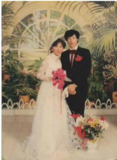
图 6 改革开放时期经典婚纱造型

统婚礼也有所回暖。为了迎合传统婚礼喜气、吉祥的氛围,新人多选择色彩艳丽的红色或黄色并带有福禄寿字样的面料,做成旗袍、褂子在婚礼上穿着 [6] 。