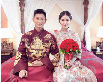
图 7 明星传统中式婚礼现场

随着时代的发展,简约的西式婚礼与传统的中式婚礼成为近年婚礼的主要形式。尤其随着中国国际地位的提升,加上优秀传统文化的回归,使得人们对传统中式婚礼及新中式婚礼的需求大大增加。另外,由于《甄嬛传》《如懿传》等古装剧的热播,汉服与古装的婚纱照成为了热门,而明星中式婚礼及婚纱照在网络上的传播(见图 7 [16] ),引领了传统中式婚礼的潮流。