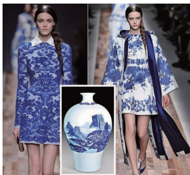
图1 2013年Valentino秋冬成衣系列

2.1.1 色彩纹样的直接运用 将蓝印花布纹样直接运用到女装设计中,可以最直观地保留大量的传统元素。2013年Valentino秋冬成衣系列中的一款服装如图1所示 [9] 。设计师直接将青花瓷(青花瓷纹样与蓝印花布白底蓝花纹样具有相同的特征)中提取的图案纹样应用于女装上,在白底的面料上仿制出青花瓷的清秀素雅,烘托含蓄婉约的东方气质。2013年3月,随国家主席习近平外访的彭丽媛身着蓝印花布上衣,引起了高度关注。这件蓝印花布上衣是凤凰团花图案,凤凰象征着富贵、吉祥,团花则象征着团圆,体现了中国深厚的文化意蕴,而中式立领又增添了东方特有的端庄、典雅 [10] 。蓝印花布中有大量的传统纹样可运用到女装设计中,但服装设计师只应用了其中很少的一部分,还有很多纹样图案尚未被挖掘。此外,在色彩方面,服装设计师还可以突破蓝白两色的限制,根据设计需要采用多种色彩,达到创新的目的。