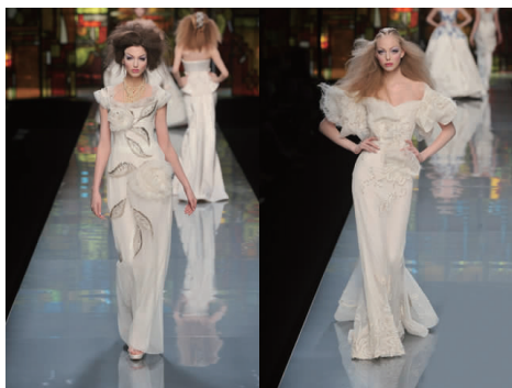
图2 2009年Dior青花瓷系列女装

元素呈现出强烈的现代感和时尚感。蓝印花布和青花瓷纹样具有共同的表现形式,Dior的设计为蓝印花布色彩纹样元素由平面到立体的创新设计及应用提供了参考,达到突显其立体性和时尚性的目的。