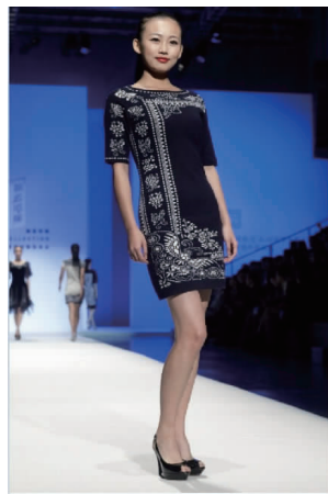
图3 蓝印花布框式构图在现代女装中的运用

2.2.1 框式构图 传统蓝印花布框式构图并不太符合现代人的审美情趣,但框式结构却天然具有对称和均衡的感觉,给人一种稳定感。因此,在女装设计中也可以加以运用,以增强着装的成熟、稳重感。蓝印花布框式构图在现代女装设计中的应用如图3所示 [11] 。图3中蓝底白花框式构图的非对称处理,稳定中透出一丝轻盈,规整中又显出不规律的时尚感。