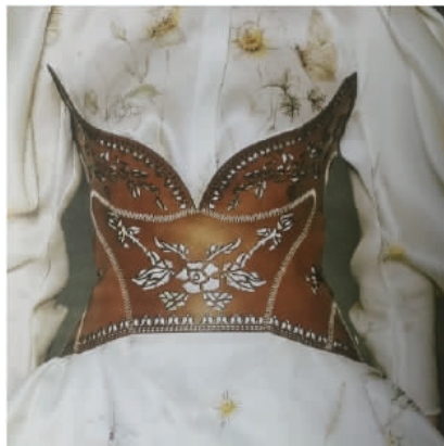
图5 蓝印花布花版作为女装腰部的装饰

背景的限制,能够大胆地将蓝印花布的元素灵活地运用到现代女装设计中;另一方面,由于文化的差异,国外的服装设计作品中并不能体现深邃的中华文化,仅是形式上的运用。