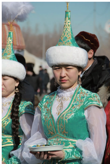
图2 哈萨克族传统女式服饰