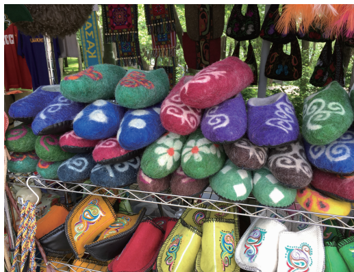
图5 用毛毡制作的拖鞋