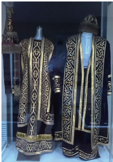
图3 古代哈萨克族贵族服饰