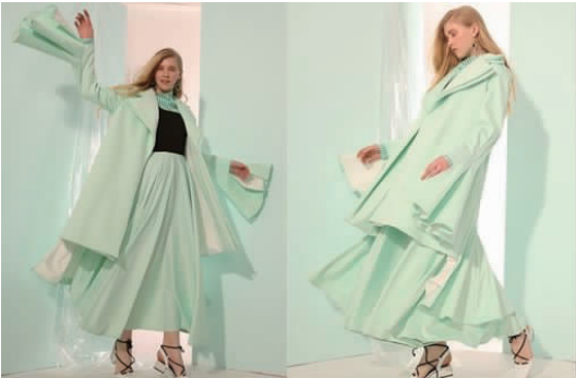
图 12 成衣

图 12 为最终成衣效果。图 12 中,紧身大摆连衣裙与半透明条格面料结合,突显女性身材的同时加强了女性的性感美,而夸张厚重的 A 字型廓形大衣增加了套装的体量感,突出了奢华庄重的感觉。