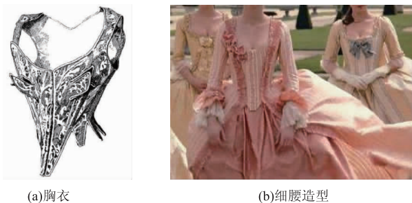
图2 胸衣及细腰造型

1.2.2 细腰造型 洛可可时期胸衣及细腰造型如图2所示。当时十分流行可以突显细腰造型的紧身胸衣(见图2(a) [7] )。大裙摆与细腰形成鲜明对比,突出女性S型曲线的线条美(见图2(b) [8] )。这说明当时的审美倾向于表现女性凹凸有致的身材,但同时也让女性的身体备受勒腰带来的摧残。