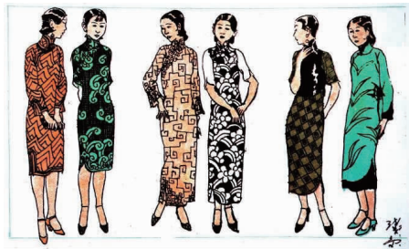
图 13 时装 6 款