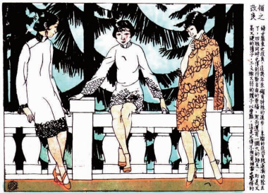
图 1 领之改革 Fig. 1 Reformation of collar-band

少飞在 1928 年就关注到旗袍领式与女性健康及穿着舒适的问题。图 1 中写道：“妇女装束之改良，这几年确有特殊的进步：束胸的恶习既逐渐除去了，四肢同时也得到行动自由的幸福，然而还有一个大的缺点，即是又高又硬的领子，予又嫩弱的颈子以磨难，这是不得不应有相当之觉悟的。”鲁少飞在枚举了服饰改良进步的同时，从旗袍改良与女性生理、心理发展的角度，提出了旗袍衣领存在的缺陷和必须改良的强烈呼吁。