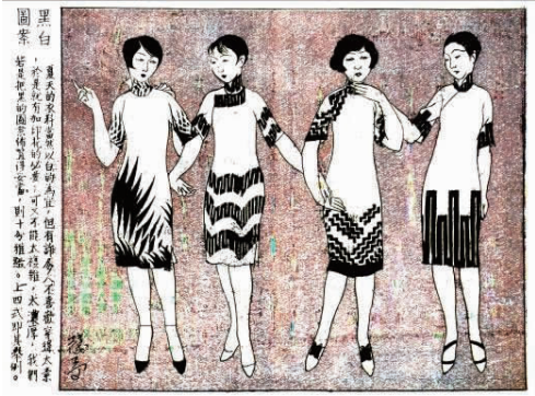
图 7 黑白图案

三角牌毛巾、毛巾毯、罗纹帐、自由布等）布匹部当过实习生、广告部画过广告，以及在花布印染厂画过花布稿的经历有关 [11] 。叶浅予在上述文字中还提到印花问题，在 20 世纪 20 年代末，上海的手工台板浆料印花和机械印花工业都得到相应的发展，但从图 7 中的图案来看，使用手工台板的型版浆料印花加工较为适合。然而当时衣料开片后的定位印花是否能很好地实现叶浅予的设计，尚需通过传世实物分析进行考证。