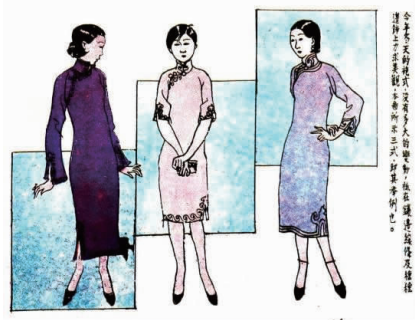
图 12 冬日袍式

图 15 [19] 为叶浅予先生时装画作品中最具形式感的一幅,也是最有设计创意的作品之一。它以“蛇”为主题,在两件旗袍披风的皮领设计上巧妙运用了蛇的造型和韵味,其他 3 幅则是通过人物的造型和面料的纹样以及不同面料的搭配使用,表现了蛇所具有的孤傲、野性、S 形的体态等,充分体现了此设计现代性和时尚性。