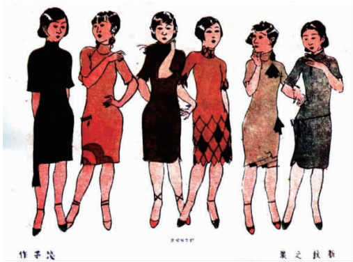
图 9 新秋之装