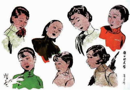
图 3 领口的样式 Fig. 3 Styles of collar-band

图 3 ~ 图 5 为叶浅予创作的与旗袍衣领相关的漫画作品 [5-7] 。在图 3 中展现的应该是当时较为流行的高硬领型 1 款；领下独用一组盘扣的开领 2 款；围领 3 款；还有立领加小翻领 1 款。可以看出：带有三排盘扣的领型占比为 1/7，表明起源于清末民初紧身短袄，带有三排盘口的高硬领型已非当时的主流了；而围领和开领各 3 种，各占 3/7，说明 1929 年左右，围领和开领流行的程度较高。