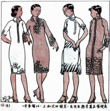
图 4 高硬领在夏季应用改良

针对旗袍衣领存在的问题，叶浅予在《高硬领在夏季应有改良》（见图 4）中，给女性读者设计了 4 款不同的领式，其文：“高硬领在夏季应有改良，略拟四式如上，以备参考。”其旗袍领型的改良设计，主要针对的是当时旗袍“高硬领”对穿着者的束缚以及不舒适性，吸收西方服装领口的样式，将旗袍衣领改良为以敞开式为主，去除了紧缚颈部的盘扣，使领型呈现较为自由、舒适的敞开式，更适合女性夏季穿着。