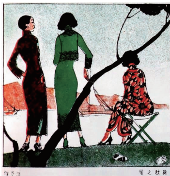
图 14 新秋之美