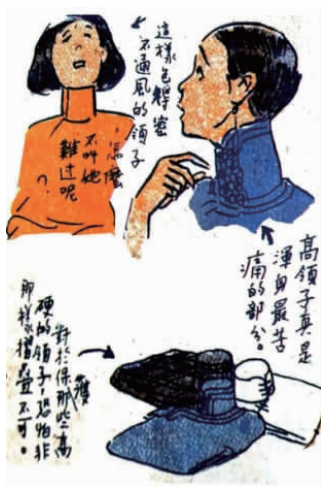
图5 最近的旗袍(局部)

的领子,恐怕非那样(单件平铺)折叠不可,”即只能一件件平铺存放。从这幅具有强烈讽刺意味的漫画中,可以推测当时女性对高领之“怨”的比例一定为数不少。1928—1930年是旗袍改良的新阶段,屠诗聘所述的:“领口也有特殊设计”,在上述几幅漫画及叶浅予的设计创意中似乎都有呈现,这几幅漫画不仅反映了当时旗袍改良和创新中的中西融合,而且还反映出当时女性“乱穿衣”现象的彷徨、徘徊状况。