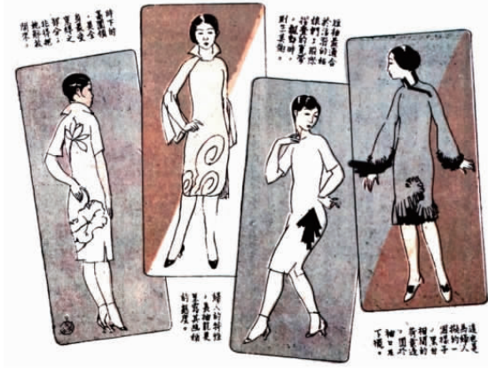
图 8 时装 4 种

图 8 为叶浅予的漫画作品《时装 4 种》 [12] 。图 8 与图 7 在旗袍的廓形设计上似乎有异曲同工之处，但图 8 更多针对旗袍的装饰细节设计提出了 4 种方案（从左至右）。第 1 幅针对“高圆领”，提出“是全身最受束缚之部分，非得把她解放开来”，为此，他设计了一款敞开的西式翻领（背面）。但在叶浅予的另一幅作品《新秋之装》中（见图 9 [13] ），6 款旗袍衣领的设计上偏偏都是“围领”。虽然叶浅予认识到了衣领的问题，但“围领”的时尚潮流让他又不得不暂时“屈从”。第 2 幅针对的是袖，他设计了一款非常时尚的开口喇叭长袖旗袍，指出“长袖能更呈露其（妇人）幽娴的态度”，这种袖型应该是借鉴了西方连衣裙的样式。此幅的领型也是敞开式的，似乎与第一幅有呼应之势。第 3 幅是针对姑娘们的短袖旗袍。建议在“股际（设计）折叠的宽带，飘动时，则生美趣”。第 4 幅为一款专为妇人们设计的旗袍。其袖口和下摆使用了黑白相间荷叶边。这种下摆加用荷叶边的款式，在旗袍初兴时期曾有流行，但叶浅予的荷叶边设计则是由后环绕至前，在旗袍的前下摆处形成一个涡旋形图案。可见叶浅予虽非服装设计科班出身，但从接触的大量西方服饰信息以及对当时服装潮流的观察中，很好领悟了服装与穿着者、设计与美感呈现的关系，对当时服装的发展、旗袍的改良起到了一种观念上的引领作用。