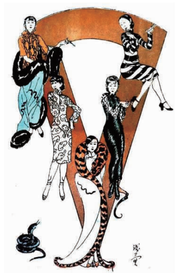
图 15 以蛇为主题的时装画