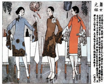
图 11 舞女之装