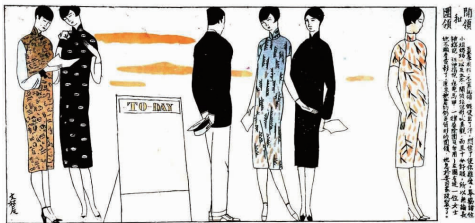
图 2 开领和围领 Fig. 2 Open collar-band and close collar-band

同样，黄文农在《开领和围领》的漫画作品中，也针对旗袍的领型提出了他的见解（见图 2 [4] ）。由图 2 可以看出，左侧 4 位穿着的是开领旗袍，而右侧一位穿着的是围领旗袍。他在文字说明中写道：“夏季衣衫，不宜围领，假使出了汗，闷住了使你难受，奉劝诸位小姐、奶奶，以及太太，开领非但形式美观，而且十分舒服，所以无论长袖旗袍，短袖旗袍，旗袍马甲一律屏除围领勿用……”最后他还揶揄地说：此图最右面的一位女士，“她不愿意看电影了，原来她穿着的仍是筒形的围领，她急着回家改制了。”一句“她急着回家改制了”，是否巧妙地表达出当时女性对围领局限的认识与改良行动呢？以上两张时装画虽一幅是针对的高硬领，一幅是针对的围领，但观念同出一辙，即提倡穿衣不但要美观、时尚，更要符合季节变化和注意穿着者的舒适度。结合《良友》《玲珑》杂志中刊登的一些呼吁“服装卫生学”的文章，说明当时人们已经开始接受了西方服饰观念，注意到服饰与人、与穿着者生理、心理的关系。