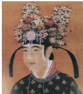
图 4 簪花侍女

1.3.1 一年景花冠 宋代最有名的花冠当属一年景。南宋诗人陆游在《老学庵笔记》记载:“京师妇女喜爱用四季景致为首饰衣裳纹样,从丝绸绢锦到首饰、鞋袜,‘皆备四时’,从头到脚展示一年四季景物的穿戴,称为一年景。” [7] 簪花侍女如图 4 所示 [8] 。该侍女戴幘头形状的冠子,冠前缀着珠翠圆花,花垂珠络,冠上插满绢制花,包括桃花、牡丹、菊花、山茶等四季花朵。由此可见,所谓一年景花冠,就是在垂脚幘头或是纱冠上,装饰四季开放的花朵装饰。