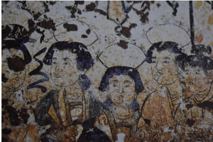
图 10 头戴扇形冠侍女

箭沟壁画墓东北壁绘制的若干头戴扇形冠侍女像如图 10 所示 [9] 。图中侍女着红、白褙子,皆戴白纱扇形冠,冠前插着一支长长的裹头簪,手持芦笙、琵琶、排笛、大鼓演奏。