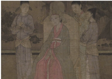
图 6 头戴莲花冠妇女

1.3.3 莲花冠 莲花冠是男女通用冠,男子所戴莲花冠,材质多为玉,女子所戴莲花冠,多以绢帛制成。头戴莲花冠妇女如图 6 所示 [8] 。莲花冠冠形高大,给人以庄严肃穆之感,冠顶形状如同寿桃,冠沿靠近额头处有一圈绢帛制成的莲花瓣用来装饰花冠,冠下面垂着两条软脚带。此冠把幞头、寿桃、莲花融为一体,具有长寿富贵的美好寓意。莲花玉冠如图 7 所示 [6] 。此冠是用青白玉雕刻的尚未开放的莲花,冠高 6 cm,宽 9 cm,中间镂空,两侧有两个小孔,用来插墨玉簪子。