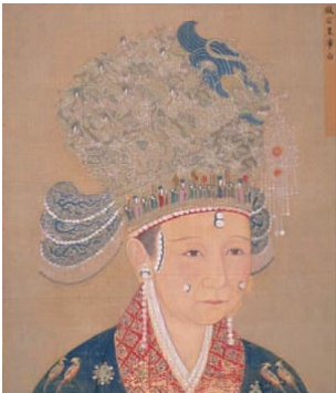
图 1 戴凤冠的宋徽宗皇后像

宋代女子戴冠是一种普遍现象,贵族妇女的冠饰也同男子冠一样,有等级之分。其中最尊贵的便是凤冠,所谓凤冠即以凤凰为名。凤凰早在汉代就作为头饰用于贵妇的装扮,皇后、皇太后头饰上就有凤凰。宋代凤冠与霞披成为皇后、皇妃、士大夫之妻女的正式礼服。戴凤冠的宋徽宗皇后像如图 1 所示 [3] 。图 1 中宋徽宗皇后头戴凤冠,冠呈椭圆形,冠上饰凤凰、仙女,冠沿上装饰着宽衣博袖的仙人像,这和宋代推崇道教有关,表达了羽化登仙的思想。南熏殿宋神宗皇后画像如图 2 所示 [3] 。图 2 中宋神宗皇后凤冠的装饰、形状和图 1 相差无几,下垂的三博鬓呈“三字”形向外延展开来,且上博鬓小,中博鬓次之,下博鬓最大。由此可知,皇后的凤冠形状不是一成不变的,随着时代发展而发生变化,以适应潮流。但无论外形怎么变,象征身份地位的龙凤、珍珠、花钗,翠钿始终不变,这是宋代凤冠的共性。