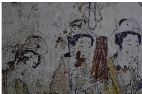
图 11 头戴元宝冠伎乐

元宝冠伎乐如图 11 所示 [9] ,图中 3 女子梳高髻,戴白色元宝冠,插簪,冠子用裹头簪固定,鬓发两旁戴珍珠钿。