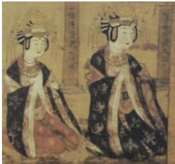
图 3 头戴白角冠妇女水月观音像

为之,而加以饰金银珠翠彩色装花。初无定制度,仁宗时,宫中以白角改造冠饰并梳,冠之长至三尺(93.6 cm,宋一尺约为 31.2 cm),有等肩者……” [5] 由此文献可知,白角冠在宋代妇女中非常流行。头戴白角冠妇女水月观音像如图 3 所示 [6] 。图 3 中有两位贵妇人,前面的妇人画像高大,戴白角金冠,冠两旁各插两朵金花,额头及鬓角上面有一对由雅白色、褐黄色组成的梳子,发髻两旁插着 3 对白玉步摇簪,尽显雍容华贵,端庄大方;后面的贵妇着黑色印花枝纹样大衫,其冠饰与前面贵妇相同。