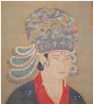
图 2 戴凤冠的宋神宗皇后像