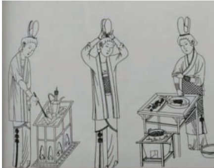
图 8 玉兰花冠侍女

1.3.4 玉兰冠 宋代有一种花冠,因其外形像尚未开放的玉兰花苞,称为玉兰花冠。玉兰花冠侍女如图 8 所示 [3] 。图中侍女皆梳高髻,戴玉兰花冠。