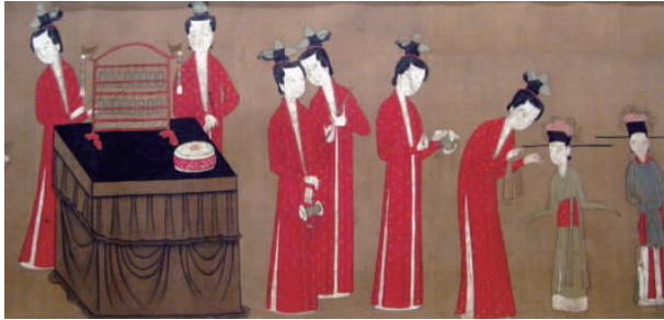
图 9 头戴花苞冠的歌姬

1.3.5 花苞冠 宋代歌姬另戴一种小冠子,因其外形有突出的三个角,远远望去就像花苞戴在头上,故名花苞冠。头戴花苞冠的歌姬如图 9 所示 [8] 。图中乐女着红色长褙子,梳高髻,戴三角花苞冠,手中持各种乐器。