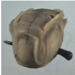
图 7 莲花玉冠