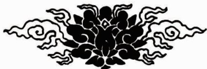
图4 清代与吉祥纹样结合的宝相花纹

在此阶段,宝相花纹样汲取众多美好纹样之精华,以表达吉祥愿望,且几乎摆脱了刚传入时浓厚的佛教文化,向祈求生活幸福美满的世俗文化发展,表达了人们对团圆、平安、吉祥的向往与期盼。同时,宝相花纹样与其他吉祥纹样的结合运用体现了人们对于美的追求与创造。