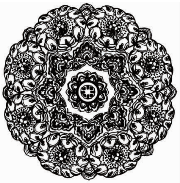
图2 唐代宝相花纹样

呈现一派繁荣景象,因而自信开放的文化视野形成了唐朝时期健美张扬的审美情趣 [6] 。在此背景下,宝相花纹样发展到了极高艺术水平。图2为唐代宝相花纹样 [2] 。其纹样造型上花茂叶盛,彰显丰满大气的唐风;结构上增加花瓣层数,形成圆形单花造型;组成上吸收了石榴、葡萄等更多的外来纹样。整体花纹中西结合,造型雍容华贵、饱满圆润,是中西方文化交流的产物,更是兼容并蓄的唐代精神的象征 [7] 。