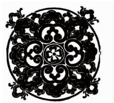
图1 清代宝相花纹样

都有各自的解释。虽然各家说法并不完全一致,但通过归纳比较,可知宝相花并非真实存在的花卉,而是通过对自然花卉进行变形处理产生的理想之花,体现了人们的艺术创造力。宝相花纹样,其本质是中古时期、特别是唐代的典型“团窠”类图案,其花心图案主要由莲花纹、牡丹纹、石榴纹等组成,是多种花卉的组合,花瓣形式有对勾瓣、侧卷瓣、云曲瓣。图1为清代宝相花纹样 [2] 。其主要特征是:以多种花卉单体的组合形式呈现,以“米”字或“十”字结构按对称放射的规律重新组合而成,形成繁而不乱的造型结构 [3] 。