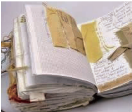
图2 旧笔记本中的灵感积累