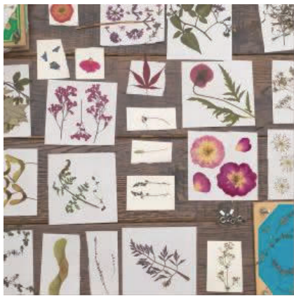
图4 自然界植物的灵感积累