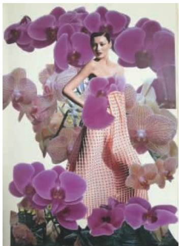
图5 手工制作灵感版

设计师在图册中不断积累视觉经验及灵感素材,并在大脑中不断强化这些视觉符号,使他们在短时间内对自己的灵感元素有充分认识,通过理性分析与感性直觉找到未来服装设计的大致方向。最终设计师通过确定设计主题和方向,为后期廓型、款式、面料等元素设计奠定基础,形成视觉材料转化的素材和有力佐证。图6为通过分析灵感素材从而确定设计方向的图册。