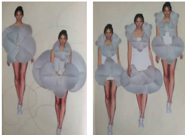
图7 提取设计元素进行重构设计

在图册的应用中使用罗列、剪贴、扭曲、重叠等手段来解构、转化、重构视觉材料,通过不断推演,依靠图册进行灵感元素的有效分析,最终得到一个或若干个造型元素。图7为提取设计元素进行的重构设计。设计师依据服装构成要素和造型设计元素形成后续设计的依托,最终完成服装款式及系列设计 [4] 。