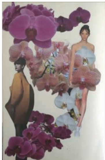
图6 分析灵感素材确定设计方向