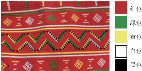
图 1 广东连南瑶族服饰图案

中国历代王朝都将服饰与礼法相联系,借服饰色彩以别尊卑,青、红、黑、白、黄 5 色为官服正色,5 色之间的间色为平民色,但瑶族服饰色彩并不分贵贱,呈现“好五色衣裳”的特点。广东连南瑶族服饰图案如图 1 所示,其中:蓝色代表宽容、典雅;红色代表热烈、豪放;黑色代表神秘、力量;白色代表纯洁、活力;黄色代表和平、安静。瑶族图案色彩鲜艳、对比强烈,饱和度高,展示了瑶族人乐观豪放和淳朴善良的民族特性 [2] 。