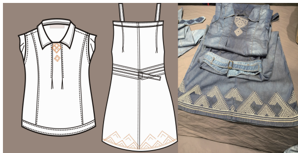
图6 连南瑶族服饰图案在牛仔吊带连衣裙设计中的应用

连南瑶族刺绣图案在牛仔连衣裙设计中的应用如图6所示(课题组成员苏成作品,摄于2016年9月12日在广东技术师范学院举办的瑶绣艺术展)。此套连衣裙由一条吊带连衣裙和一件翻领上衣搭配而成,设计元素为瑶族传统图案“马头纹”。马头纹在瑶族传统服饰中常出现在衣服的下摆,由红色、白色、黄色3色组成,以二方连续的形式排列,色彩跳跃,对比鲜明。在应用时,对“马头纹”的造型进行创新设计,并将颜色改为纯净的米黄色,使其更加符合消费者审美,满足人们日常穿着的需要。