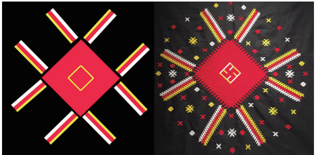
图 2 广东连南瑶族蜘蛛纹刺绣图案

相传在隋唐时期,瑶族的族人曾遭到官兵的追杀,他们逃到山顶,走投无路时钻进一个山洞,洞口的很多蜘蛛就立刻结网把洞口封住,当官兵赶到洞口时,看到有很多蜘蛛网,断定瑶族人没有在洞里就离开了。蜘蛛救了瑶族的祖先,为了纪念蜘蛛的救命之恩,瑶族绣娘就将蜘蛛绣在了服饰上,世代相传,以表达对蜘蛛的感恩,并成为瑶族人的“护身符”。广东连南瑶族蜘蛛纹刺绣图案如图 2 所示。由图 2 可以看出,蜘蛛纹整体造型被抽象概括为几个几何形的组合,中间为一个红色的菱形,旁边为 8 条黄、红、白 3 色相间的矩形。菱形代表蜘蛛的身体,中间装饰“万字纹”;菱形的 4 条边向四周放射,形成 8 条矩形分别位于菱形的上、下、左、右 4 个方向,代表蜘蛛的身体;在蜘蛛纹周围还有一些黄色、白色、红色的“斜十字纹”“井字纹”及菱形点缀,代表蜘蛛结的网。