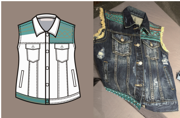
图 5 连南瑶族刺绣图案在牛仔马甲设计中的应用

连南瑶族服饰图案在牛仔马甲设计中的应用如图 5 所示。图案中融入了盘王印、水波纹、山形纹等元素,将其运用在牛仔马甲的过肩设计和下摆设计中,并以珠绣点缀。图案色彩打破传统形式,绿色和红色交替出现,并在袖笼的位置以黄色毛边设计做映衬。瑶族刺绣图案搭配牛仔做旧工艺和洗水工艺,粗中有细,很好地表现了传统和现代元素的融合。