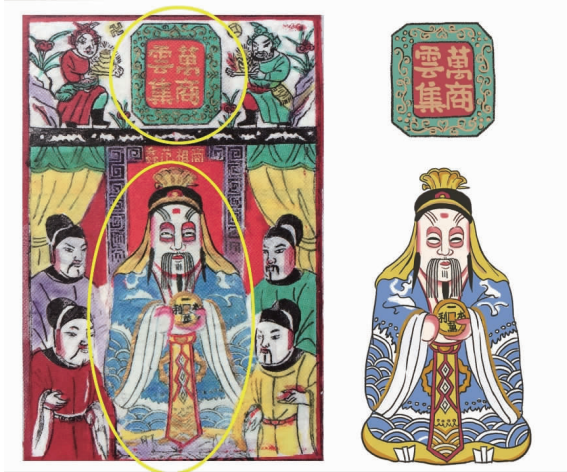
图 7 以纸马原人物造型及装饰元素进行二次描绘 Fig. 7 Secondary depiction based on the Zhima original character modeling and decorative elements

祖范蠡。这 6 位行业神造型各具特色,为保留其风采,作者按照原人物造型,在电脑上用相近线条、纹理的笔刷描绘图案,具体如图 7 所示。无锡纸马中的吉祥题字图案也独具特色,6 位行业神对应不同的吉祥题字,将题字图案应用在画面中既能与神祇相互呼应,又能赋予图案吉祥美好的寓意。每位神祇所持法器作为辨别符号,具有极简的装饰效果,用于丰富画面,让构图变得趣味生动。无锡纸马是中国民间传统文化的载体之一,其中涵盖了许多中国传统文化符号,如万字纹、寿字纹、祥云等,同样也可以作为设计元素运用到装饰图案中。色彩以无锡纸马的红、绿、黄为主色调,结合现代色彩学中对比色、互补色和同类色的配色规律,让图案色彩既能和谐统一,又具有民俗特色和装饰效果。构图上采用“外方内圆”的形式(见图 8),表达美满吉祥的寓意,并根据图案的构成方式进行布局,达到装饰美感。