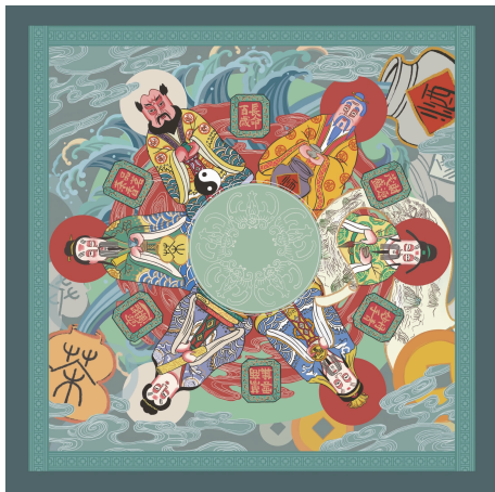
图9 适形图案《六神踏瑞霭》

综合以上对无锡纸马艺术视觉元素的提取与归纳,并结合现代审美,作者设计出系列现代装饰图案,适形图案作品《六神踏瑞霭》如图9所示、四方连续图案作品《纸马系列》如图10所示。设计的装饰图案作品充满无锡地域文化特色与现代装饰美感。