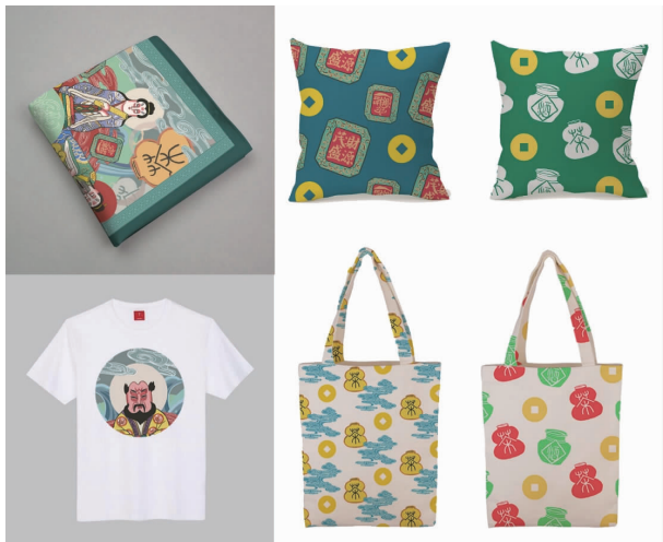
图12 纸马装饰图案应用在丝巾、T恤、抱枕、帆布包上的效果

案应用在丝巾、T恤、抱枕、帆布包上的效果如图12所示。无锡纸马本身属于祭祀用品,通过再设计的方式将无锡纸马艺术以新的形式装点在各种产品中,装点人们的生活,如旅游、服饰、包装、家纺等产品,符合古为今用的设计原则,弘扬传统文化,为保护和传承无锡纸马艺术提供了新途径。