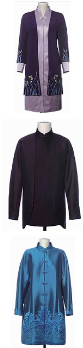
图 1 2014 年北京 APEC 会议各国领导人服装

水江崖纹”“宝相花”等纹饰传达吉祥如意;服装整体风格雍容、华贵、大气,体现了中国传统审美意蕴和文化气质,是无形的文化元素与当代设计思想完美融合。