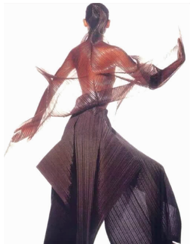
图2 三宅一生设计作品