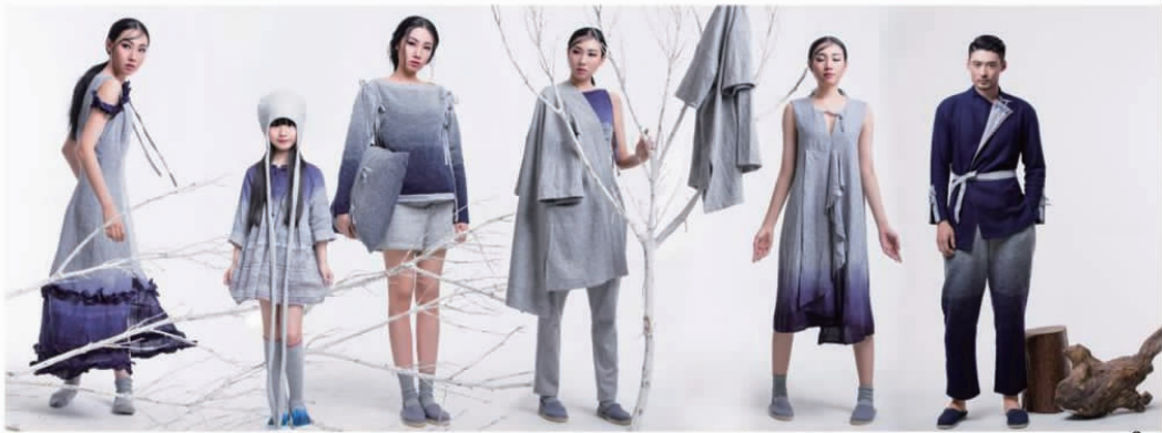
图5 造型设计 Fig.5 Style design

的组合方式完成系列的造型设计,具体如图5所示。图5中的作品通过平面、直线的剪裁塑造简洁、流畅的线条,在服装的结构设计上最大限度减少省道,强调立体造型的结构,在追求精简与质朴中呈现返璞归真的自然状态。