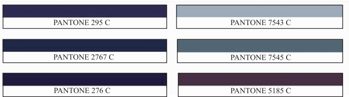
图 3 色彩选择

3.2.1 色彩选择 道家强调物质生活上的寡欲、淡泊,因此,在色彩审美方面也追求素淡之境。老子认为“五色令人目盲” [2] ,从艺术审美的角度进行理解,是指艳丽的色彩会使人迷失本性,因此道家反对儒家所提倡的文礼隆盛、五色绮丽。在设计实践中所选择的色彩如图 3 所示。以接近黑色的黛蓝,搭配浅灰色、白色,并采用草木染工艺进行渐变处理,形成如山水画般的渲染效果,朦胧、平和的色彩给人舒适放松感,表达自然、恬静、虚无的美学理念。