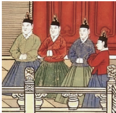
(a)《明宪宗元宵行乐图》局部

袄是明代女子穿着最为普遍的上衣,也是明代女子服装最具代表性的款式。在很多容像、风俗画、水陆画中都能够非常直观清晰地看到女子着袄的形象。另外,根据这些绘画作品所属年代,也可以看出不同时期的主流女袄的形制特征,具体如图5所示。图5(a)为现藏于中国国家博物馆的王锡爵墓出土的《明宪宗元宵行乐图》,它生动地展现了明代成化年间后宫女子的便服形象:上穿交领右衽女袄,下着马面裙;在图5(b)明代万历年间孝靖皇后的画像中,则是内穿竖领对襟,外穿方领对襟,皆用纽扣闭合。这也从一个侧面说明了明代宫中女袄领型的流变。