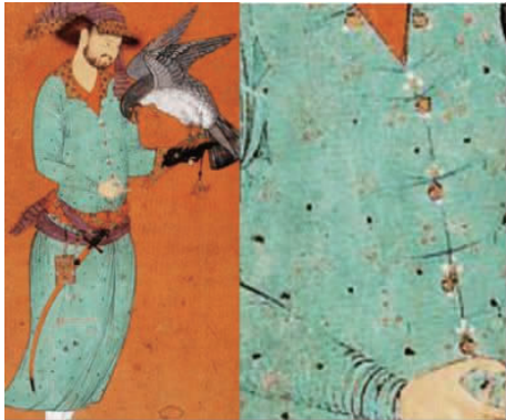
图6 约1580年伊朗对襟服饰

出使西洋等因素,促使商品经济及手工业出现了繁荣景象,为明中后期服饰的变化奠定了基础。而在明代中后期,繁荣的中外贸易交流使得西亚、中亚与中土的来往更加频繁,同时也让西亚与中亚人的服饰在中土频频亮相,图6为16世纪80年代伊朗对襟服饰。缝缀着做工精美并且亮光闪闪的金属纽扣的对襟服饰自然会引起明人的兴趣,再加上当时政治松散、经济繁荣以及人们价值取向的改变,对其进行模仿自然就不奇怪。这种搭配金属纽扣的服饰形制与明代女袄领部装饰金口的方式异曲同工,双方服饰文化相互融合,致使明代中后期竖领、圆领、方领对襟配金属纽扣形制的女袄成为一种新的流行时尚。这些对襟类的女袄形制之所以在明代流行,很可能就是为了给制造精美、装饰华丽的纽扣一个良好的展示空间。