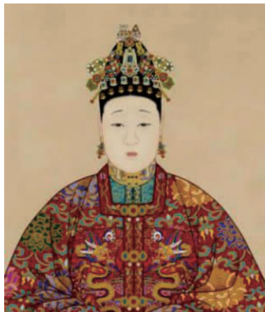
(b)明万历孝靖皇后画像