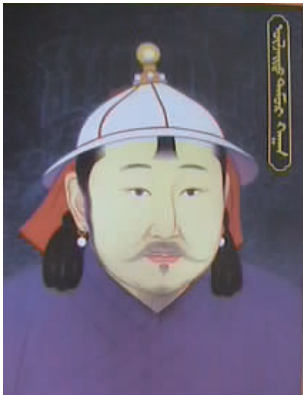
图 7 元朝皇帝 Fig.7 An emperor of Yuan Dynasty

4.3.1 改革的原因 ①辫发胡服是元朝的象征,高丽想摆脱元朝控制,该服饰改革作为向元朝挑战的先锋。②元朝衰落后,长期受压迫的百姓渴望统治者能果断反抗,此举顺应民意,增加了高丽自我发展的凝聚力。③高丽需要依附大国保护自己,明朝符合这个期望。