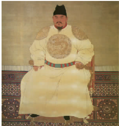
图 9 明太祖朱元璋 Fig.9 Founder of Ming Dynasty Zhu Yuanzhang

高丽的政治发展分成 3 个时期,政治波动造成服饰制度出现了 8 个转折点。前期主要政治问题是国王权力和豪族势力的争夺,太祖沿袭新罗的服饰制度安抚各地守旧势力,成功度过了开国的艰难时期,光宗时期王权取胜后制定百官公服,上下等级尊卑鲜明;中期受儒教政治的影响,几代国王将服饰制度日益完善和秩序化,仁宗、毅宗详细制定了服饰体系,武臣政权导致了服饰制度被僭越式破坏,同时标志武臣的军服、下吏服得到发展;后期高丽受元朝的高压控制,在联姻交流和蒙古血统的双重支配下,高丽施行辫发胡服,向元朝示好;元朝衰落明朝建立后,追求独立的恭愍王摒弃胡服,同时向明朝请赐服饰;新兴士大夫势力兴起并掌权后出于慕华心理和寻求庇护,服饰制度转而与明朝相仿。