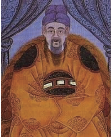
图 8 恭愍王 Fig.8 King Gongmin