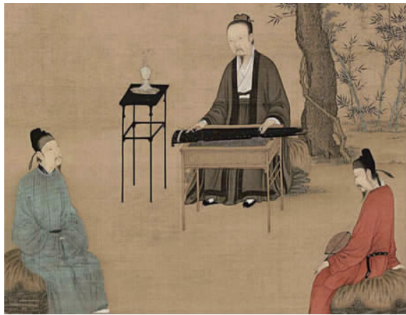
图 5 宋代文人