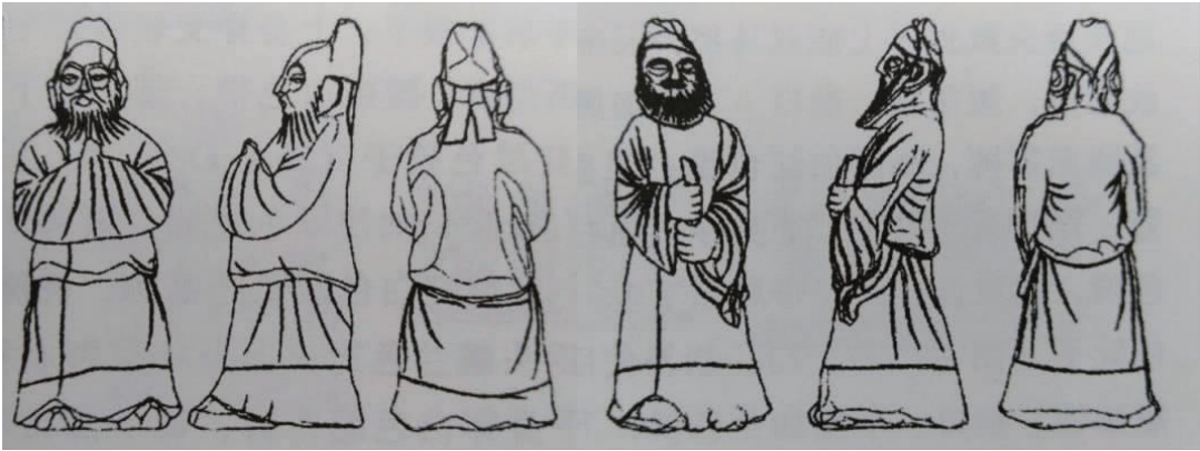
图 3 新罗时期的文官俑