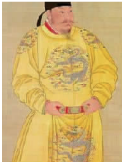
图 2 唐朝皇帝