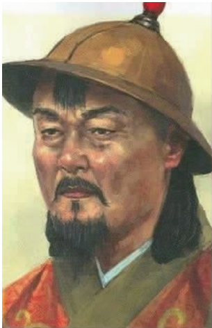
图 6 忠宣王 Fig.6 Chungseon