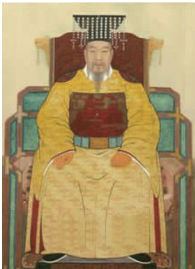
图 1 高丽太祖

2.2.2 承袭的内容 “高丽太祖开国,事多草创,因用罗旧。” [3] 具体包括:①“视朝之服,国初用拓黄袍。” [4] 具体如图 1 所示。黄色是古代中原王朝尊崇的服色,在真德女王时期新罗衣冠制度遵从唐朝,高丽沿袭了这一传统。图 2 为唐朝皇帝画像。由图 2 可以看出,这种继承不仅在颜色,而且还有圆领、胸前和两肩的纹样和腰间的玉带。②高丽国王最初接见官员戴乌纱高帽,着宽袖绀袍,束带 [4] 。1986 年发掘的新罗时期庆州龙岳洞古坟,出土了两个文官俑,具体如图 3 所示 [5] 。图 3 中的文官俑均穿右衽圆领袍,上戴襌头。③女子的阔袖衣、色丝带、大裙子也继承了新罗服饰。