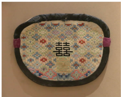
图1 南通传统民间刺绣

“仿真绣”亦称“沈秀”,由清末民初的刺绣艺术家沈寿创造,其艺术风格与灵魂在于一个“真”。仿真绣的画稿以油画、照片和自然界的物体为对象,吸收西洋油画的用光、用色、明暗关系,以中国传统的刺绣针法和绣线表现西方艺术。用针方面改变了以往刺绣中平铺直套的针法,而是根据物象的肌理用旋转针,按自然物的形状旋转铺绣,将虚实针、散整针、施毛针巧妙并用,绣面富有变化且和谐统一。用线方面则是将绣线的颜色按照画稿进行染色,极大地丰富了色彩的表现力,使画面呈现出非常丰富的色彩变化。仿真绣强调明暗、光影的关系,既传承了苏绣,也是苏绣之创新,作为南通刺绣的重要组成部分,“仿真绣”的逼真、传神是其他刺绣所无法比拟的,也是其根本的艺术风格所在。南通传统民间刺绣如图1所示。