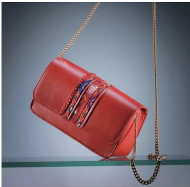
图3 苗绣品牌女包 Fig.3 Miao embroidery lady handbag