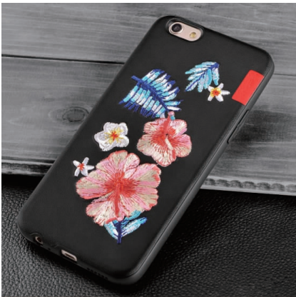
图2 刺绣手机壳 Fig.2 Embroidered phone case

3.1.2 载体应用创新 目前南通刺绣的载体应用主要包括工艺服饰、装饰艺术品、陈设品领域。对比其他地域的刺绣衍生品的载体,南通刺绣衍生品可以从装饰、家纺、工艺品、商务用品、数码电子产品、时尚配饰等诸多方面进行演绎。如时下流行的手机保护壳、商务名片夹都是可以充分利用的载体,具体如图2~图4所示。