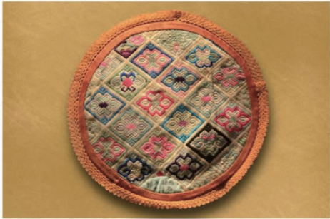
图4 刺绣衍生品 Fig.4 Embroidery derivatives