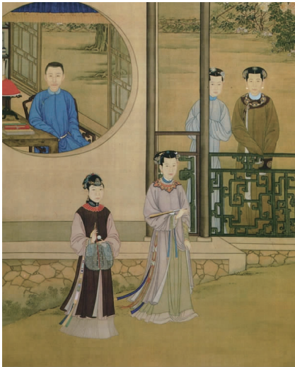
图 2 雍正行乐图