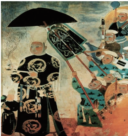
图 1 莫高窟第 409 窟西夏王