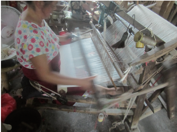
图5 新余昌坊的熟夏布织造