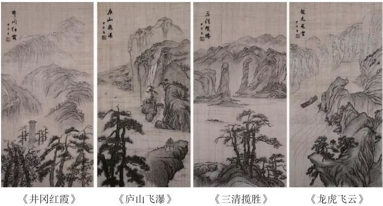
图2 新余夏布绣江西名山系列

新余夏布绣从民间麻绣中蜕变,在传承与发展中焕发出新的生命力。改革开放以来随着化纤面料的推广,手工纺织的夏布开始从人们生活视野中淡出,传统的女红也被现代化的纺织品所取代,加之审美观念的变化,民间麻绣失去了赖以生存的文化土壤,庆幸的是,一批绣娘面对窘境,思索着转型之路。新余夏布绣国家级传承人张小红女士,放弃民间麻绣,最先使用植物染料染底色,发挥绣地夏布古朴醇厚的特色,同时借鉴其他绣种针法,以文人水墨画为基础,以线代墨、以针代笔,弱化色彩,突出肌理,形成线迹与绣地肌理、色泽等浑然天成的观赏性美术绣。《绣谱》曰:“至于师造化以赋形,究万物之情志,又于才人笔墨,名于丹青同臻其妙”。夏布绣娘在刺绣前选稿时,以反映地域文化的作品优先并充分领悟画意,令新余夏布绣具有地域文化特色和文人书画的艺术魅力,从而具备艺术收藏与经济价值。新余渝州绣坊联合艺术家,以江西名山为题材创作的系列夏布绣如图2所示。