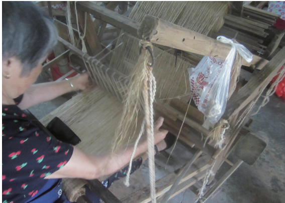
图4 新余昌坊的生夏布织造

如若脱胶不够,则可通过日晒夜露的方式进一步处理,即晴朗的夜间将夏布铺在水边的草地上接收露水浸润,早晚洒水两次,白天收起,悬挂于户外晾衣杆上,利用日光照射,干后翻转晾晒,这样可以起到漂白脱胶软化的目的。新余日光充足,境内多山泉水便于浸濯漂洗,这种生态夏布练漂工艺一直沿用至今。