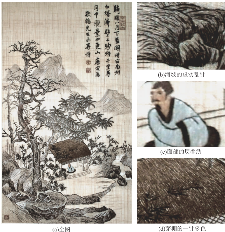
图7 夏布绣《茆庵静坐图》

夏布经纬稀,层叠针易于表现画面微妙的过渡效果。层叠针同苏绣的施针类似,施针采用稀针打底、分层逐步加密镶色,绣面丰满、丝理转折自然,是绣动物羽毛与人像的主要针法。俗话说:“麻布挑花,一针对一孔”。夏布经纬纱空隙大,针线绷紧时容易出现空窗,布面粗糙有色泽,不适合表现精细的局部,而夏布绣的层叠针要求轮廓清晰且不能露出绣地,不能出现空窗,刺绣主体同夏布绣绣地肌理形成强烈的对比,其主要步骤为第一层采用等长线条均匀排列铺底,线条间距两针;第二层按第一层方式施针镶色,后层层相嵌直至绣成。图7(c)为人物面部的层叠绣,针脚细密不露绣地,晕色自然,与粗糙的夏布绣地比较,表现出夏布绣拙中寓秀的特色。