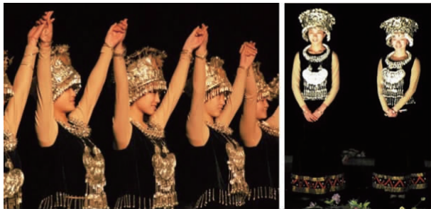
图5 《印象刘三姐》银烙服饰

两个方面:①减少整套服装的件数尽可能将单独的零部件放在一件服装上。②对服装细节进行微妙处理,像扣子多的传统服装可以改成里面是隐形拉链的假扣子。目的是方便演员穿脱,快速换装,且有效防止散碎零部件掉落。服装材质的“仿生耦元序贯优化设计”包括3个方面:①装饰性材质增强舞台效果。装饰性材质不局限于纺织面料,金属、丝网、灯等等都可代替原本单一的服饰品,不仅增加了服装的立体效果也加强了装饰感,如图5《印象刘三姐》中的银烙服饰用灯代替银饰,达到了适当的效果。②以降低成本为目的。由于舞台与观众有一定距离,表演服装着重要求视觉效果,故常用锦纶代替丝绸、贴花替换刺绣等。③面料代替人体皮肤保证文明演出。这在多部旅游剧中都运用过,如《印象刘三姐》中的浴女、《千回大宋》中千手千眼的舞蹈服等。色彩的“优化设计”根据面料吸收光源的特性,适当改变服装的原本色彩,达到理想的舞台色彩。由于面料吸收光源的特性不同,自然光下色泽好看的面料在舞台灯光的照射下未必有同样的效果;某些在自然光下看似偏离原本的颜色但在舞台灯光下恰好能表现出原本颜色,因此,可以选用这种灯光差距色代替服饰的原本色。