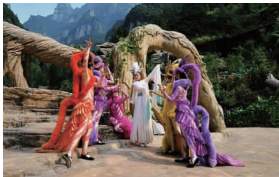
图4 《天门狐仙》狐狸服饰