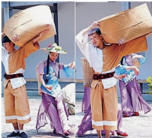
图3 《印象大红袍》演员服饰

法使服装象形化。狐狸脸型的帽子、大毛领、紧身衣加拖尾蓬蓬裙等服装造型表现了狐狸的特点,色彩是根据狐狸艳丽的印象而采用黄、红、绿、紫等鲜艳色,材质用皮草、蕾丝、弹力面料、雪纺综合表现狐狸毛皮,最终观众可通过服装看出狐狸的形态。舞台服装不同于生活服装,它有多方面的限制因素,如距离感既要求服装有较强的装饰满足视觉观感等,又要具备表演艺术性 [4] 。因此,舞台服装必定要在生活服装的基础上重新设计,生成“印象化”的服装。