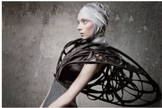
图9 款式与造型一体化设计

服装的款式与结构一体化的设计手法。款式与服装结构联系在一起,服装构成分功能性的结构分割和装饰性分割。①功能性的结构分割,服装结构中对人体关键部位的修饰分割设计和省道转移分割设计。如连衣裙中胸腰的设计,大多利用分割解决胸腰差量,功能分割在解决实际人体问题的同时也塑造了服装的形制。②装饰性分割,按照形式美法则分割出具有装饰意义的部分,在能够精确表现主人公(正面或反面的)性格的关键位置装饰 [7] 。如选取手捏戏文服饰造型中某一个局部或其中的一组造型,进行分割设计或抽象概括成几何形,在服装的关键部位如肩、腰等部位进行装饰性分割。两种方法的共同点是画面构成多为立体形态或抽象的几何立体造型,具体如图9所示。款式与服装结构同步设计的方法,使服装款式具有整体性和掌控性,即将造型服务于服装整体,又能在关键的部位采用适当的形进而达到美化人体的效果。