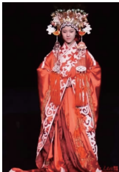
图2 《平遥印象》赵家媳妇