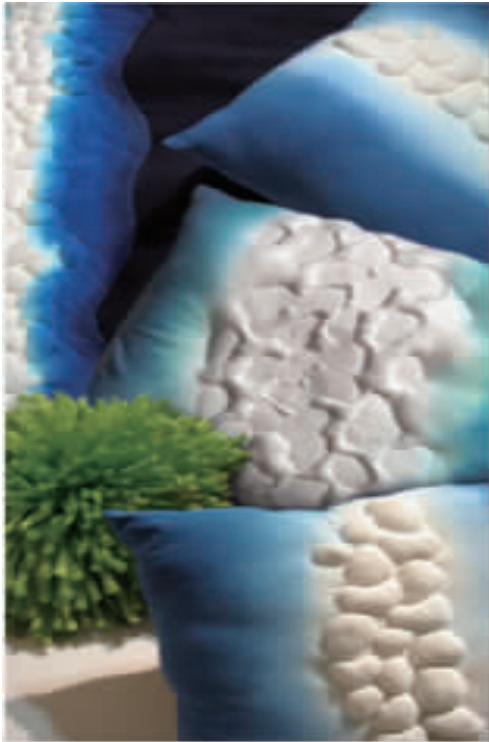
图 3 云石 Fig.3 Marble

在先,而传统印染抽象形式美的形成是通过染色过程中的偶发因素(如扎染中纹样扎结的松紧,织物的折叠皱缩,染料的染色速率及扩散速率,染色时间等)产生的。传统印染的这种抽象形式美特征迎合了现代人的审美需求,赋予了传统印染艺术浓厚的时代气息,是古老的传统印染艺术在现代继续繁荣发展不可缺少的重要审美因素。图 3 为广美染织专业学生利用手工染色和绗绣工艺设计的系列抱枕,作品巧妙地把具象和抽象的图形融合在一起,既体现了传统工艺的美感又有很强的时尚气息和趣味。