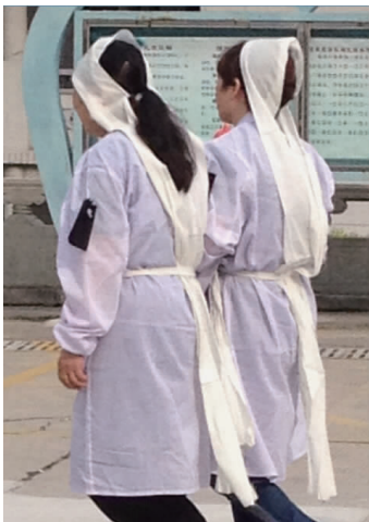
图 4 女儿丧服 Fig.4 Daughter's mourning

其代表城市徐州受经济发展以及南北文化影响,其丧服形制在城乡间有了很大的不同。在徐州农村地区的丧服一般由白色的孝衣、孝帽、孝鞋组成(见表 3)。徐州部分地区女儿采用“披孝衣”的形式,即将一块白布披在身上,且在脚踝处缠绕白布,并用黑色布条系紧,俗称“绑腿”(见图 5)。通常当地男性的孝帽为三角帽或者圆形孝帽,而女性