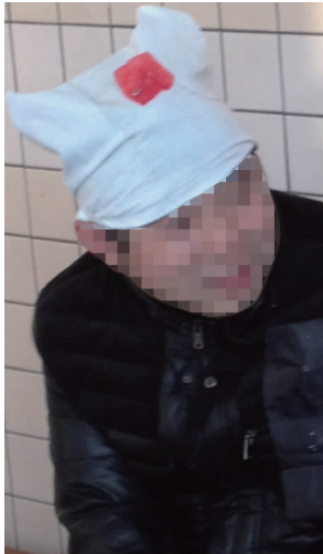
图 11 孙子辈孝帽 Fig. 11 Grandson's mourning

据当地老人描述,如果死者是高寿过世,则孙子辈采用红白双色的孝服(见图 12),过百岁的老人过世,重孙辈则用黄色,如果死者的儿子已经不在