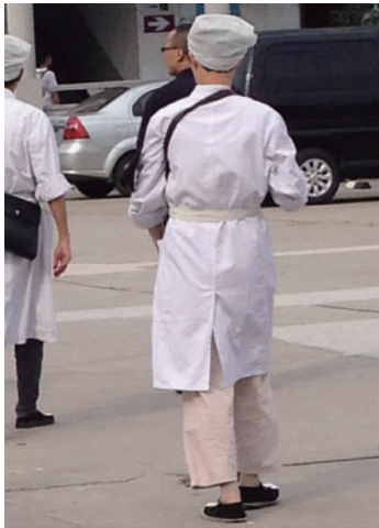
图 3 孝子丧服 Fig.3 Son's mourning