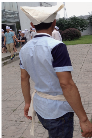
图 16 三角形孝帽

1) 孝衣:当地儿子、媳妇、孙子辈和侄子所穿的孝衣就是一根白腰带,女儿和女婿则是采用“披孝衣”的形式,将白布对折并在折痕处穿一窄布带,穿着时,用带子将孝衣抽紧,类似双层披风,将带子在脖子处打结固定,并在腰上系一根白腰带(见图 17)。侄女的孝衣通常是一块白色包头布,平辈亲友则在左臂上扎一块白布条。