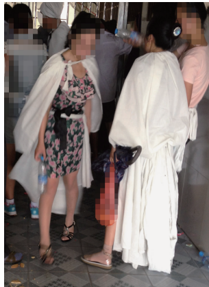
图 17 女儿“披孝衣”