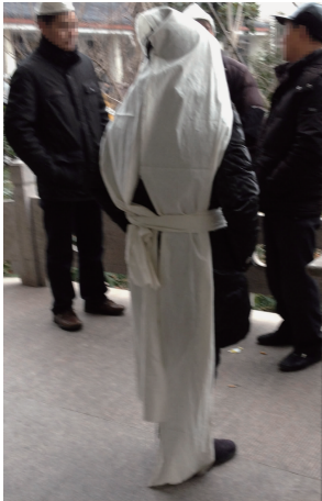
图 10 白披头 Fig. 10 Daughter's mourning clothing

的孝帽用红色,未婚的是全红,已婚的孙子辈则女性为红白相间的“披头”,男性则是钉有一块红布的白色孝帽(见图 11,12);部分地区的孙子辈会在头上扎一块红毛巾,而远亲与朋友则扎白毛巾。