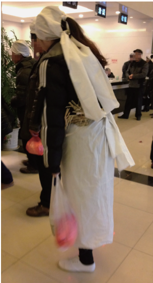
图 9 儿媳丧服 Fig. 9 Daughter-in-law's mourning clothing

泰州市西接扬州,北邻盐城,东依南通,南靠长江,水路交通十分便利,文化交流便捷,但其丧服基本还是沿用传统丧服形制:孝帽,白腰带,孝鞋。通常女儿的“白披头”要长及脚踝(见图 10),孙子辈