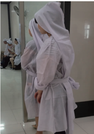
图 15 “白披头”