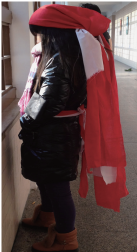
图 12 双色孝服 Fig. 12 Two-color mourning

世了,那么则由孙子代替儿子,戴麻质孝帽,而孙媳妇则是钉有白布的麻质孝帽(见图 13)。