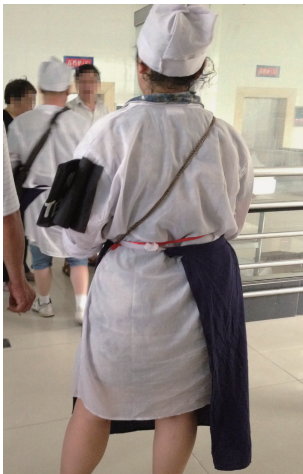
图 14 儿媳孝衣

帽(见图 16)均采用白线缝合,侄子辈则用彩线缝合。死者的第四代子孙(曾孙、曾孙女辈)则需要带红色孝帽;第五代子孙(玄孙辈)则是绿色孝帽,都是表示死者长寿且多子多福的意思。儿媳和女婿如亲生父母健在,则在孝鞋后跟处用蓝笔画一道或者钉一块蓝色小布条。旧时长辈也要给晚辈穿丧服,但现今父母等长辈不为小辈穿丧服。当今的丧服文化是一种民俗文化的传承与弘扬,主要传达一种“孝”的观念。