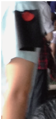
图 2 红点臂章

由此看出,金陵文化下的丧服具有开放兼容、中西合璧的特点,表达了遵循孝义的传统理念,且其完全符合金陵文化的个性,展现了当地文化的交融性和开放性。