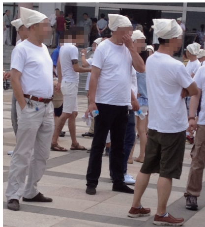
图7 文化衫代替白孝衣