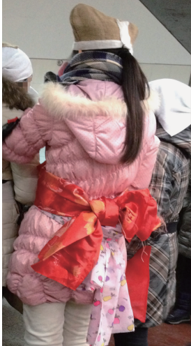
图 13 麻布孝帽 Fig. 13 Linen mourning cap

农村部分地区,会有儿媳围蓝色围裙的丧服形制,或是将一整块白布披在身上的形式。泰州地区丧服形制中基本没有出现黑臂章和小白花等附属物。