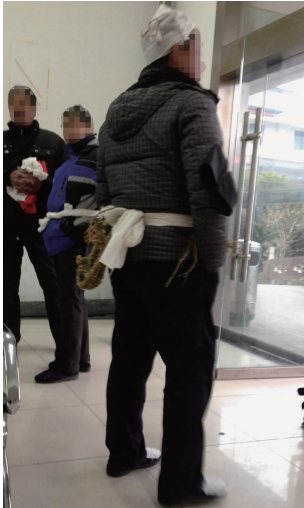
图 8 孝子丧服 Fig. 8 Son's mourning clothing