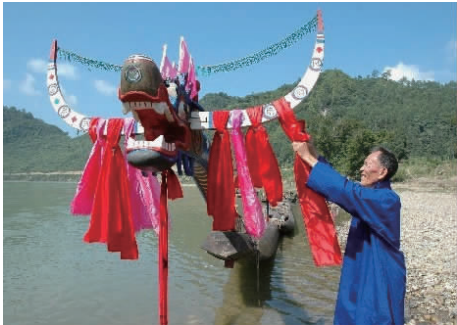
图 11 苗族牛角龙头的龙舟