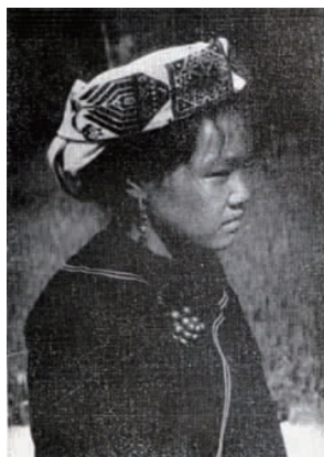
图 24 近代湘西苗族女子包头