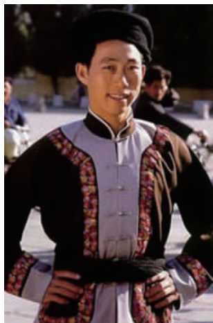
图 26 现代湘西苗族男子包头