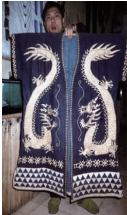
图 10 古代绣有龙图纹的男装

傩,是一种古老的文化现象,指古时腊月驱逐疫鬼的仪式。在先秦时的古代文献中即有关于傩文化的记载。《论语·乡党》曰:“乡人傩”。《吕氏春秋·季冬》亦曰:“命有司大傩。”傩文化活动在秦汉之际随军旅传入西南。在一些苗族村寨的节庆祭典活动中,都离不开傩面具。这一点,也有古籍作证,汉代刘定的《舆地志》记载荆南风俗时说:“荆南人众,祈福避灾,习俗各异,身着彩衣,面戴面具,披发仗剑者皆有。”从这些遗留下来的傩面具中,人们又仿佛看见了“师公”们祭祀驱邪的身影(见图 14、图 15)。