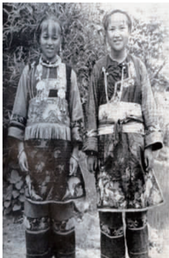
图 30 近代湘西苗族银饰 2