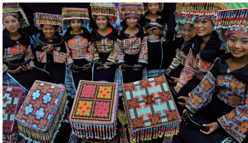
图 23 湘西苗族节庆服装 3