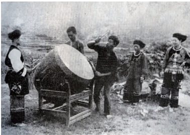
图 2 鼓舞 Fig.2 Drum dance