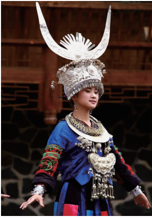
图 32 现代湘西苗族银饰 2