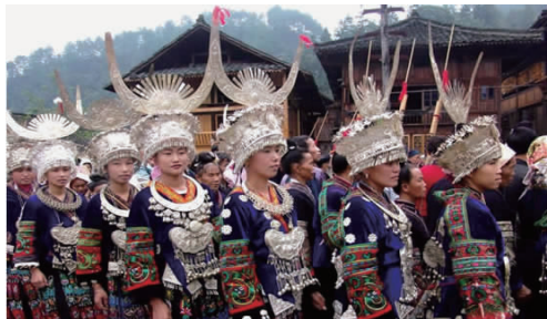
图 22 湘西苗族节庆服装 2