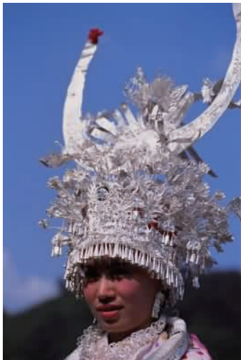
图 27 湘西苗族女子银冠 1

苗族姑娘的银冠有排马、银花草、银风雀、银葵、银蝶、银响铃等,满头银饰繁花似锦、富丽至及,银冠高高戴在头上,十分漂亮。其形制和汉族的风冠无二 [7-8] 。汉族的风冠起源于汉朝,想必是在汉苗两族数千年的接触往来中,风冠在苗区得以传承和发展,成为苗族颇具民族代表性的头饰(见图 27、图 28)。