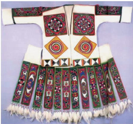
图 7 百鸟衣 Fig.7 Birds dress