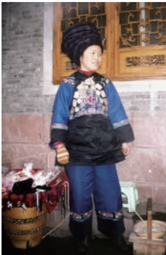
图 20 现代湘西苗族女装 2