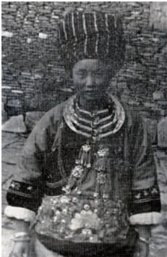
图 29 近代湘西苗族银饰 1

银饰构成了苗族服饰的重要组成部分。其银饰种类繁多,造型奇特,工艺精致(见图 29 ~ 图 33)。苗族姑娘胸前大都佩戴着硕大的银锁,银锁是苗族银装中的主要饰物,制作得十分精美,银匠在压制出的浮雕式纹样上鑲出细部,纹样有龙、双狮、鱼、蝴蝶、绣球、花草等。银锁下沿垂有银链、银片、银铃等。有的称其为“长命锁”、“银压领”等 [8] 。金锁、银锁在汉族服饰当中也被普遍使用,其制作方法以及纹样和苗族的银锁也是同出一辙。这也佐证了汉苗两族在银饰艺术上的渊源。