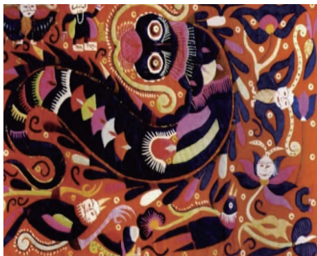
图 13 龙纹 2