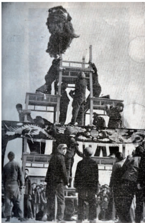
图 8 苗寨舞狮(上有龙的图案)

湘西苗族信仰以傩神为主的傩巫鬼教,相信万物有灵 [5] 。苗族巫师在从事祭祀活动时,除借助于服饰外,还有一种不可或缺的法器,既是傩面具。