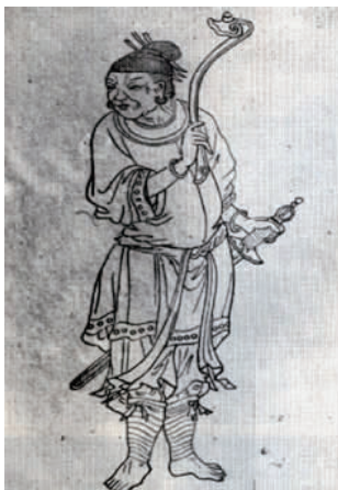
图 25 古代湘西苗族男子包头