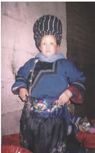
图 19 现代湘西苗族女装 1