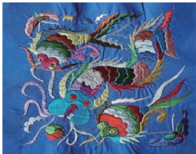
图 37 刺绣作品(鱼纹)