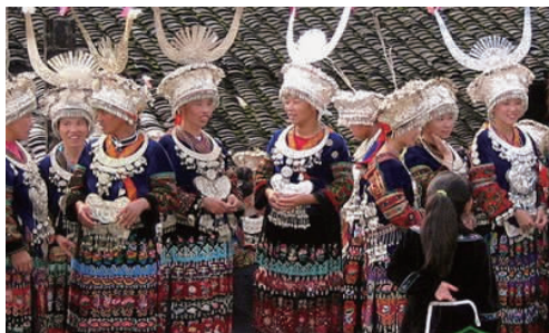
图 21 湘西苗族节庆服装 1