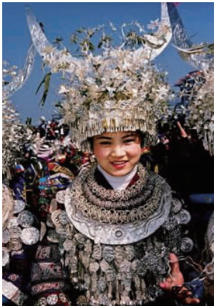
图 31 现代湘西苗族银饰 1