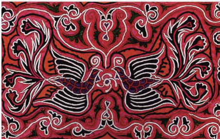
图 6 凤纹衣纹样 Fig.6 Phoenix on grain garment