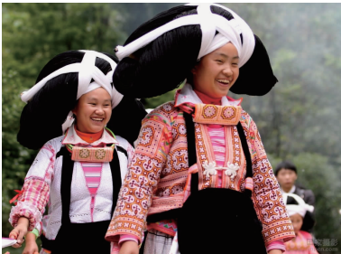
图 3 木质牛角形头饰 Fig.3 Wooden horn headdress