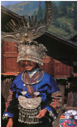
图 4 银质牛角形头饰 Fig.4 Silver horn headdress

2.1.2 鸟图腾 中国远古夏民族崇拜龙图腾,黄龙就是禹。商民族崇尚鸟(燕子)图腾,后来燕鸟逐渐融合在凤鸟之中。闻一多《伏羲考》中考释“黄帝大战蚩尤,便是龙图腾崇拜的原始夏人和鸟图腾崇拜的原始殷人之间的战争,并以此加强自己部落自然界的地位。”以鸟为图腾的商民族领袖“神农炎帝”正是苗族的另一祖先,而鸟也自然成为苗族的图腾。在湘西苗族服饰中,凤与鸟是经常出现的动物,苗族的挑花、刺绣、织锦、蜡染、剪纸、首饰等,都无一例外地充满了凤鸟的图纹 [5] (见图5~图7)。这与汉族以凤为图腾是一脉相承的。这也正是原始的华夏文化在苗族服饰文化中的体现。