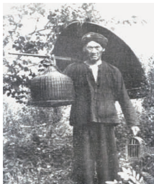
图 17 近代湘西苗族男装