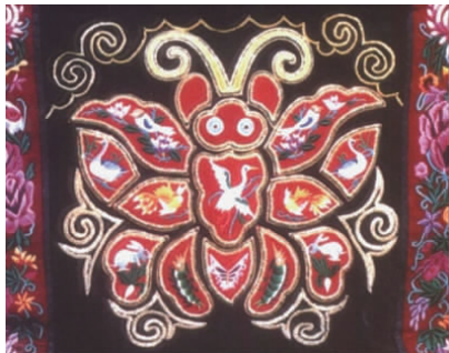
图 36 刺绣作品(蝴蝶纹)