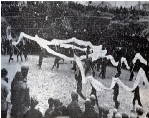
图 9 苗寨舞龙