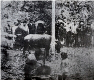
图 1 椎牛 Fig.1 Vertebral cattle

制而成。两角高高耸立,形如水牛角,上有“二龙戏珠”等花纹图案,银角间还插以压花银扇(见图4)。无论木质还是银质,都是历史悠久的苗族传统头饰,它的形成与汉苗的历史渊源和原始牛图腾崇拜有着密切的关系。