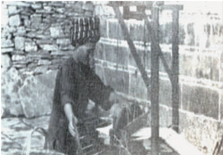
图 34 织锦

西苗族妇女刺绣多用在服饰的头巾、衣领、衣襟、肩摆、袖腰、袖口、裤脚,裙边、围裙、背裙、帐檐、鞋子等,这与汉族妇女传统服饰绣花的位置一致,其绣品平滑光亮、色彩和谐、技艺精巧,与苏绣、湘绣同样驰名中外,是我国的著名地方绣之一(见图 35 ~ 图 37)。