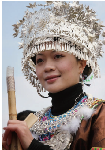
图 28 湘西苗族女子银冠 2