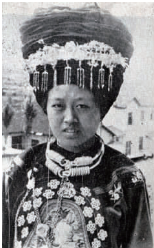
图 18 近代湘西苗族女装

随着汉文化的传播,湘西苗族服饰明显吸收了汉族的特点,妇女由穿裙改为穿裤,上衣圆领,衣襟、袖口、下摆及裤脚均镶绣宽幅、多层花边 [6] 。湘西一部分苗族女装是满襟套头式,这保留了我国夏商时代的服装结构;还有一部分苗族女装是右衽开襟式,很明显这种服装结构受到了从周代一直延续至清代的深衣制度的影响;一些女装在上衣外边加套一件有刺绣图案和缀满银片的胸衣,这是苗族女装对明清时期汉族女装的借鉴,形成了自己颇有民族特点的服装(见图 18 ~ 图 20)。