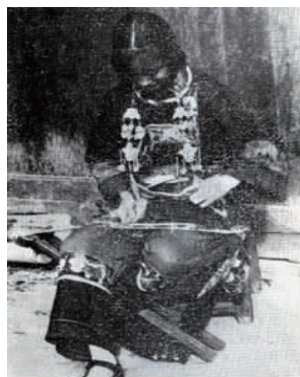
图 16 近代湘西苗族女装