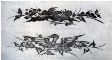
图 5 湘西苗族鸟图腾 Fig.5 Bird totem of the Miao Nationality in western Hunan

2.1.2 鸟图腾 中国远古夏民族崇拜龙图腾,黄龙就是禹。商民族崇尚鸟(燕子)图腾,后来燕鸟逐渐融合在凤鸟之中。闻一多《伏羲考》中考释“黄帝大战蚩尤,便是龙图腾崇拜的原始夏人和鸟图腾崇拜的原始殷人之间的战争,并以此加强自己部落自然界的地位。”以鸟为图腾的商民族领袖“神农炎帝”正是苗族的另一祖先,而鸟也自然成为苗族的图腾。在湘西苗族服饰中,凤与鸟是经常出现的动物,苗族的挑花、刺绣、织锦、蜡染、剪纸、首饰等,都无一例外地充满了凤鸟的图纹 [5] (见图5~图7)。这与汉族以凤为图腾是一脉相承的。这也正是原始的华夏文化在苗族服饰文化中的体现。