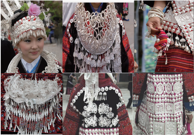
图 33 现代湘西苗族银饰 3