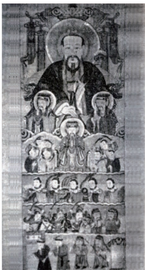
图 14 傩公