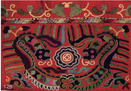
图 12 龙纹 1